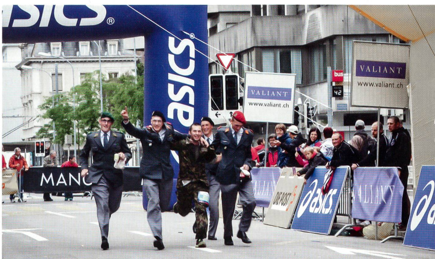
Geschafft: eine ganze Staffel empfängt den Schlussläufer am Ziel.