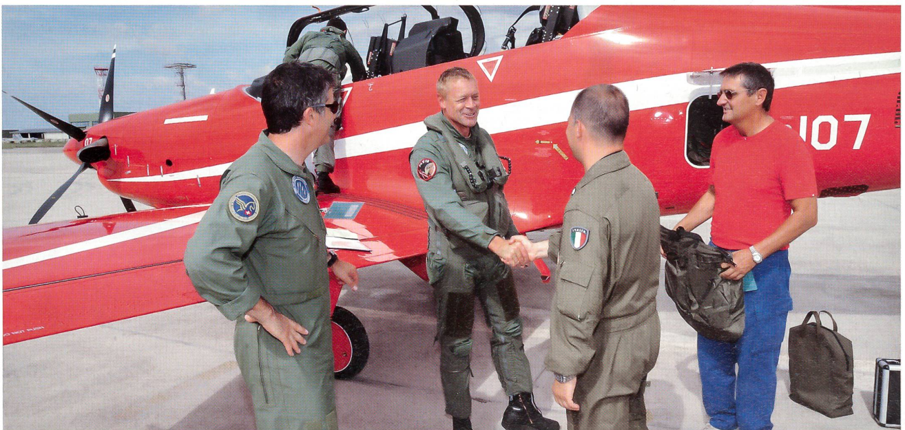
Freundschaftlich-kameradschaftliche Begrüssung im italienischen Galatina bei Lecce.