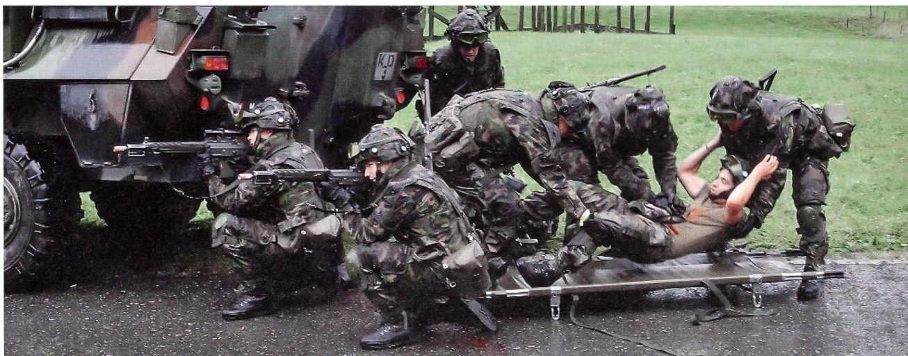
Die Planung für die Armee 2016 ist vorangekommen: Künftig sollen alle Wehrpflichtigen nur noch fünfmal in den WK einrücken.