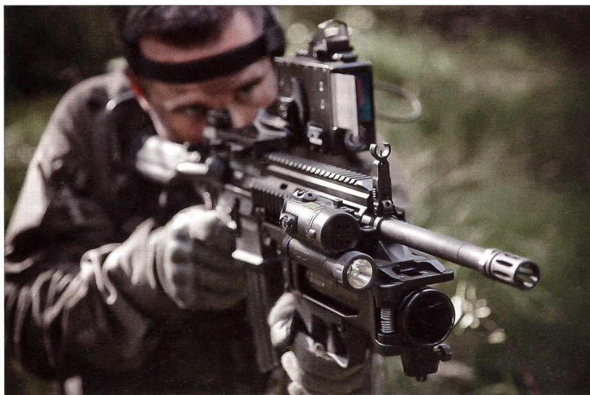
Gut sichtbar ist der am Gewehr angebrachte 40 mm Granatwerfer und die Zielvorrichtungen mit Laser und Lampe.

Mit Skyshield können die Geschosse der 35-mm-Kanone so programmiert werden, dass sie unmittelbar vor dem Ziel explodieren und den Angreifer in der Luft unschädlich machen. Diese Art des Bekämpfens auf relativ kurze Distanz ist kosteneffizienter als zum Beispiel der Ab-