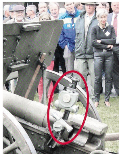
Richtaufsatz mit Regierungsrätin Widmer.