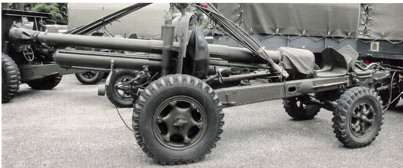
Die Schwere Kanone 10,5 cm, zu ihrer Zeit das beste Geschütz: robust, treffsicher, weitreichend, stationiert in Sion und im Ceneri.