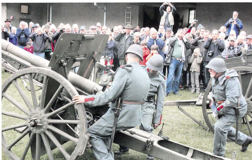
Das «Schiessen» ist in vollem Gang: Richter, Verschlusswart und Geschützführer.