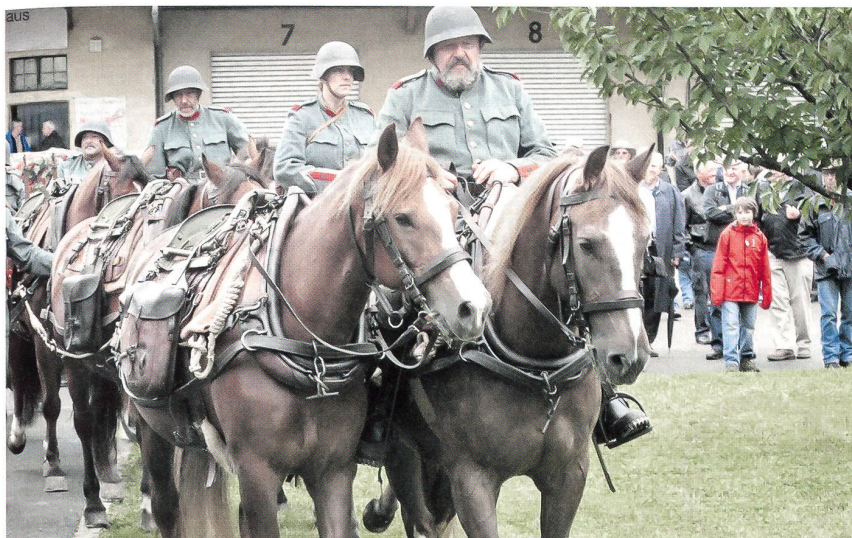
Der Einzug der pferdegezogenen, sechsspännig gefahrenen 7,5 cm Feldkanone 03/12.