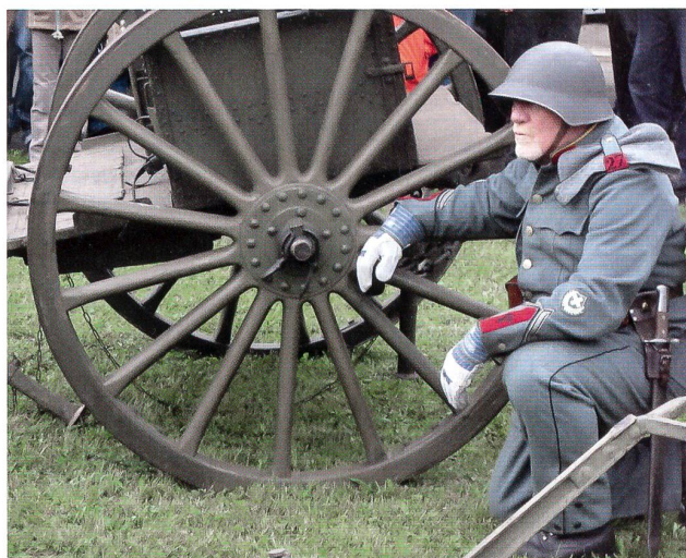
Der Geschützführer-Wachtmeister – mit Gold am Kragen.