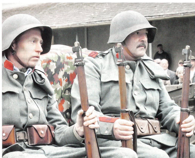
27er Kanoniere mit Stahlhelm und der roten Waffenfarbe.