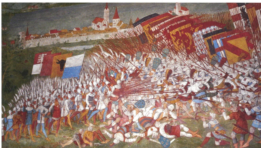
Die ruhmreiche Schlacht von Sempach 1386. Eidgenossen links, Habsburger rechts.