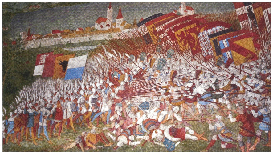
Die ruhmreiche Schlacht von Sempach 1386. Eidgenossen links, Habsburger rechts.

Oberst i Gst Stüssi-Lauterburg stellt die Ereignisse am Morgarten (1315) und in Sempach (1386) in Zusammenhang. Die Kapelle wurde ein Jahr nach der Schlacht über den Gräbern der Gefallenen erbaut, die wegen der Sommerhitze nicht mitgenommen werden konnten. Im 17. und 18.