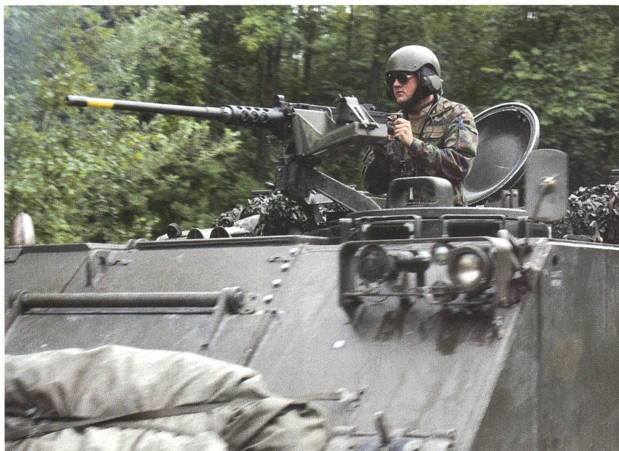
In den Vaterschaftsurlaub statt in den WK? Eine Bieridee – mitten im Wahlkampf!

Denn der Korpsgeist, der unseren Einheiten im Katastropheneinsatz oder im Gefecht die Leistungsfähigkeit der Verbände entscheidend verbessert und das Vertrauen der Soldaten in ihre Kameraden an ihrer Seite spiegelt, kann nicht befohlen werden, er muss gelebt werden. Genau dies