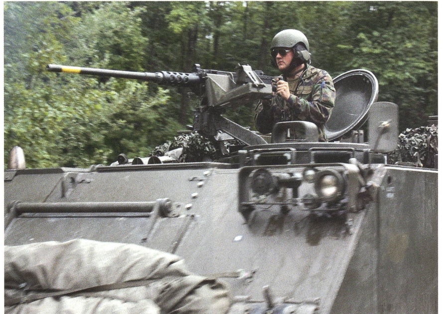
In den Vaterschaftsurlaub statt in den WK? Eine Bieridee – mitten im Wahlkampf!

Denn der Korpsgeist, der unseren Einheiten im Katastropheneinsatz oder im Gefecht die Leistungsfähigkeit der Verbände entscheidend verbessert und das Vertrauen der Soldaten in ihre Kameraden an ihrer Seite spiegelt, kann nicht befohlen werden, er muss gelebt werden. Genau dies