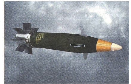
Das Artilleriegeschoss «M982 Excalibur».

Raytheon hat einen Auftrag über 172,6 Millionen US-Dollar zur Lieferung von GPS-gelenkten 155mm-Artilleriegranaten des Typs «M982 Excalibur» erhalten. Insbesondere für die Einsätze in Afghanistan ist die