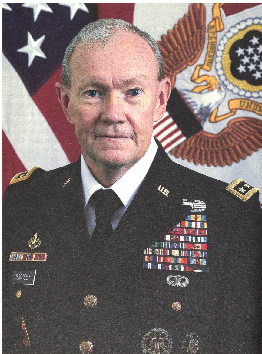
Der neue Chairman Joint Chiefs of Staff, General Martin Dempsey, ist ein Heeresoffizier.

Es wird nun gemutmasst, dass Verteidigungsminister Gates und Admiral Mullen gegen die Wahl des eher introvertierten und stark auf Hochtechnologie setzenden Cartwright gewesen seien, weil sie sich in dessen Ratschlägen ans Weisse Haus übergangen gefühlt hätten, aber auch weil sein