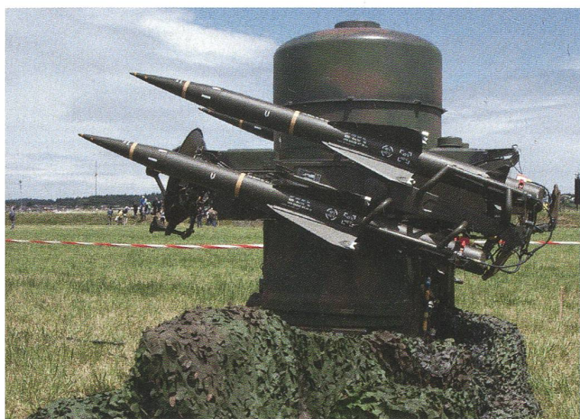
Mit TRIO vorwärts: Der Rapier, ein zweiter Teil vom TRIO.