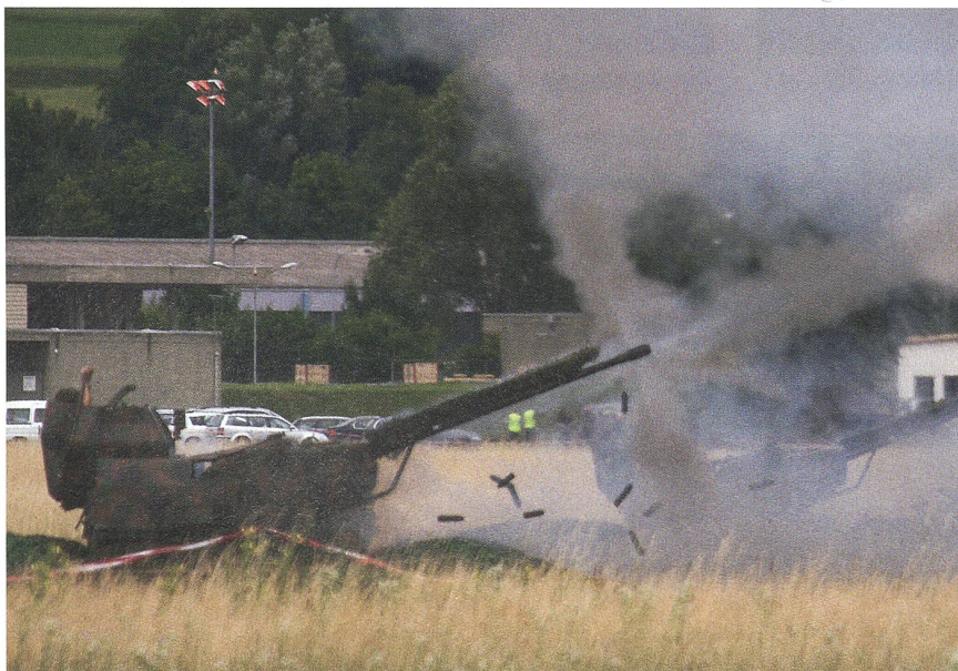
Mit TRIO vorwärts: Die 35-mm-Fliegerabwehrkanone, ein erster Teil vom TRIO.