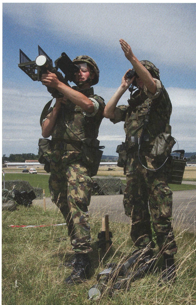
Mit TRIO vorwärts: Die Stinger-Rakete als dritter TRIO-Teil.