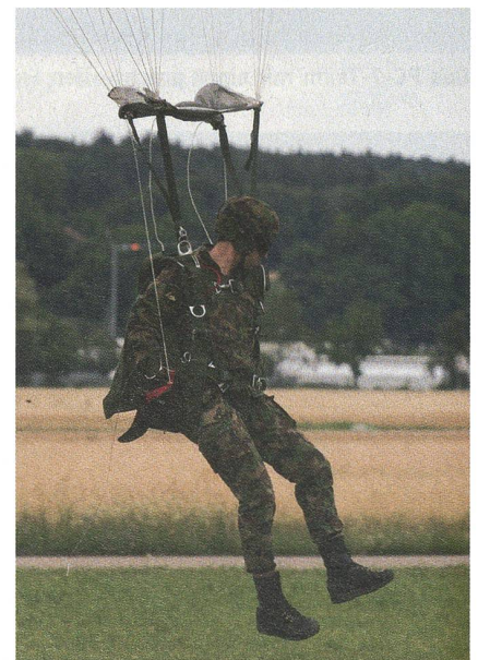
Vom Himmel hoch, da komm ich her...