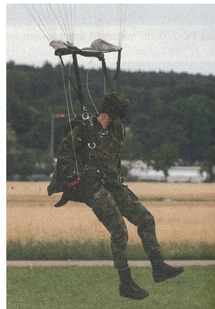
Vom Himmel hoch, da komm ich her...