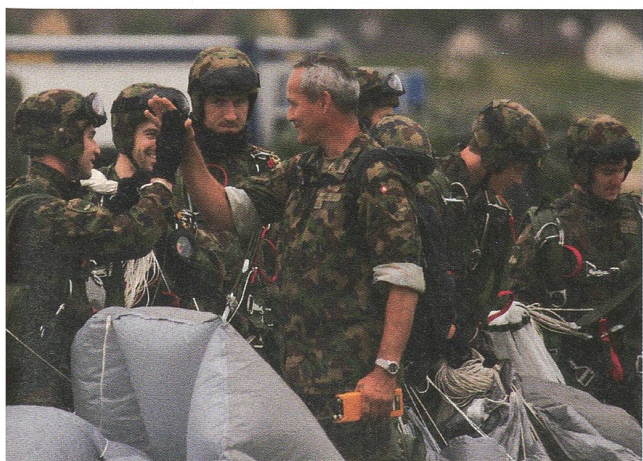
Gratulation nach erfolgreichem Sprung: Fallschirmaufklärer.