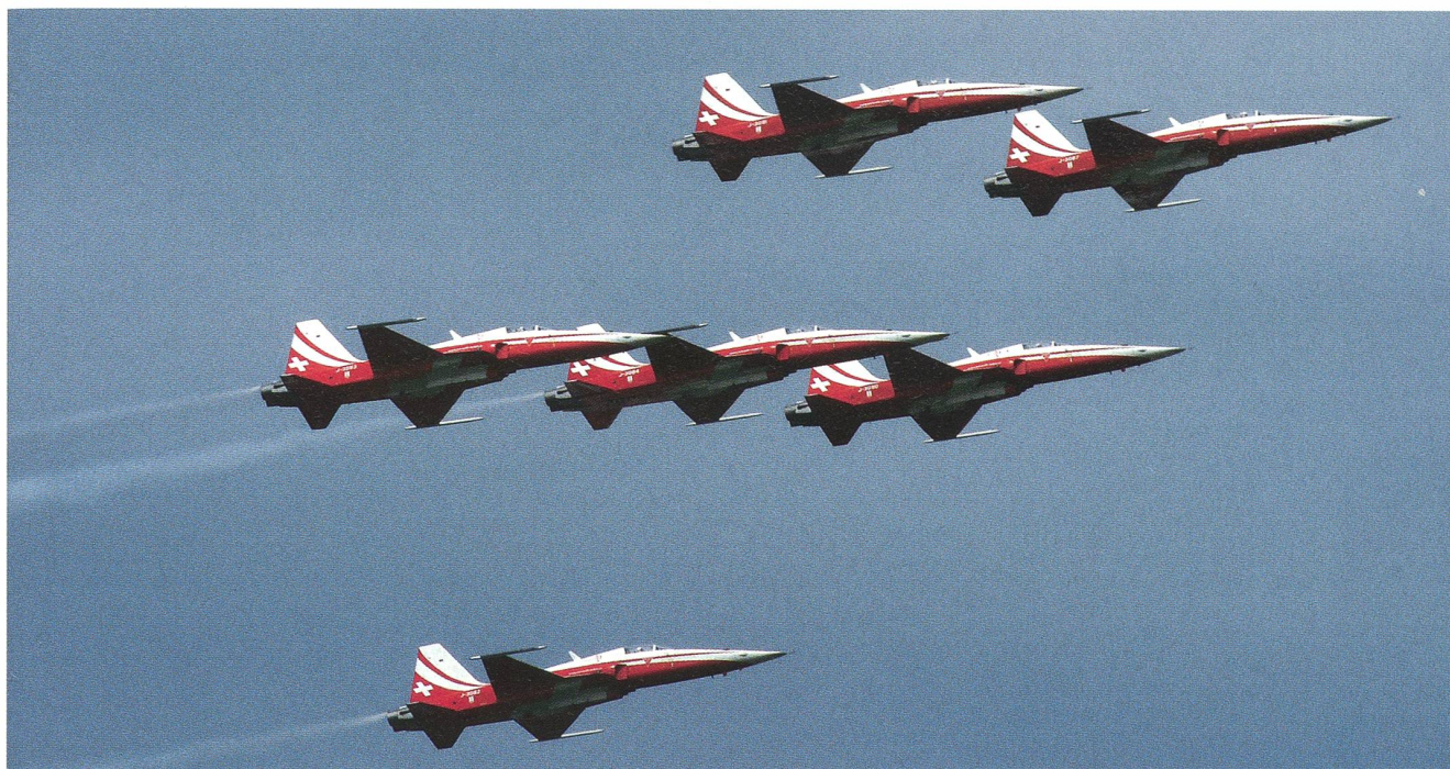
Immer ein Höhepunkt für das zahlreiche Publikum: Die Patrouille Suisse mit ihren sechs Tiger-Maschinen am blauen Himmel.