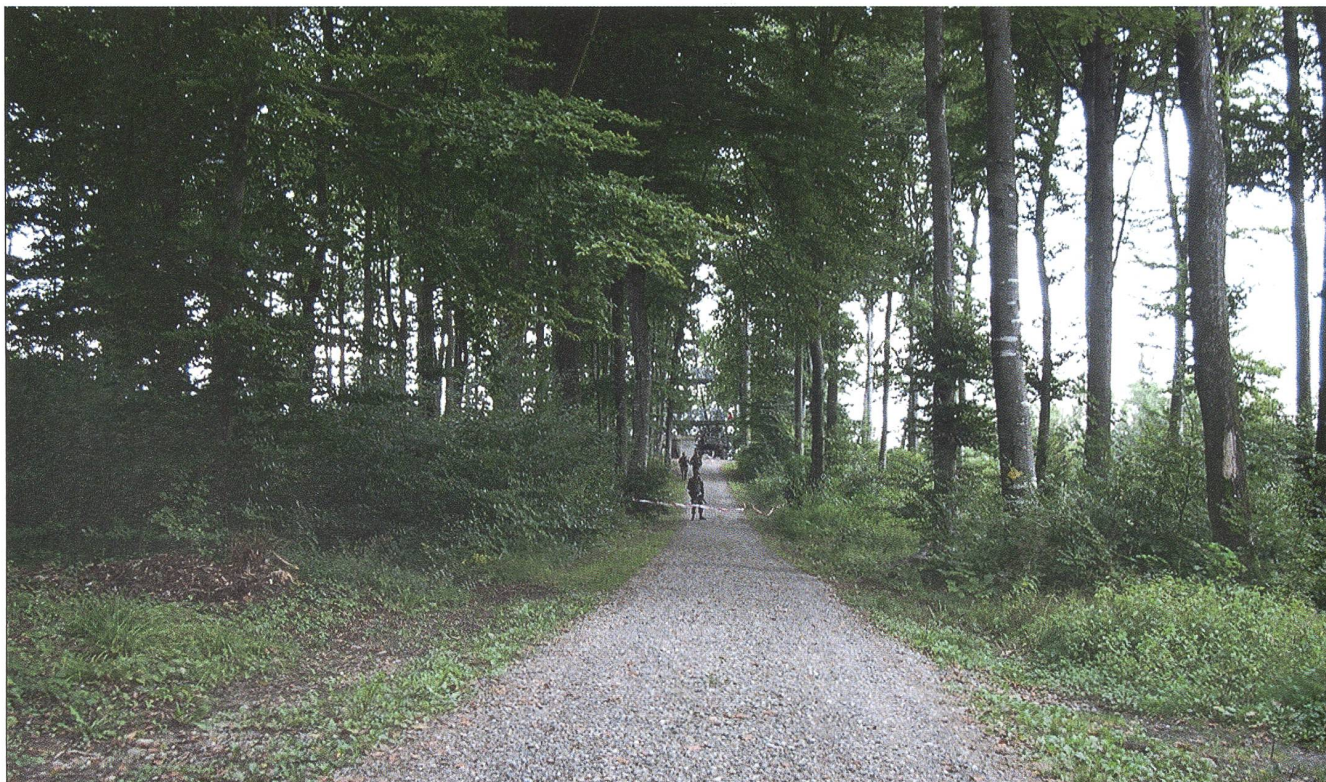
Bericht über Bericht: Wohin führt der Weg der Schweizer Armee? Nur zu einer starken, glaubwürdigen Landesverteidigung!

Daher steht die Landesverteidigung – in welcher Form auch immer – im Zentrum der Armee. Das Konzept zur Wahrung der Verteidigungskompetenz mit einer bis zwei Bri-