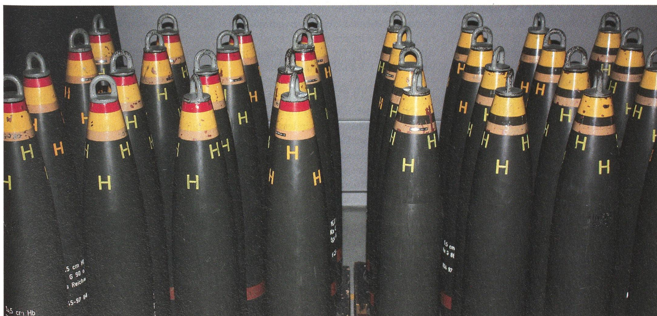
Diese Munition darf nicht vernichtet werden: Links das 15,5 cm Pz Hb Ka G 90 ohne Zünder, rechts das 15,5 cm Pz Hb Ka G 88.