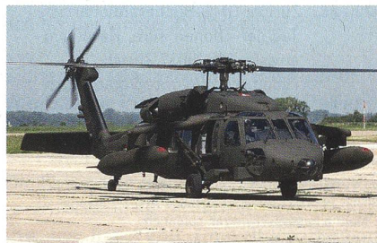
Sikorsky T-70 Black Hawk mit Zusatztanks.

Das türkische Verteidigungsministerium hat bei der Ausschreibung nach einem neuen Mehrzweckhubschrauber, welches unter der Bezeichnung Turkish Utility Helicopter läuft, der Firma Sikorsky, welche mit dem S-70i Black Hawk angetreten ist,