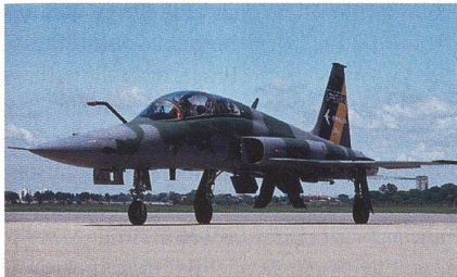
F-5BR mit Luftbetankungssonde.

Die brasilianische Elbit-Tochter AEL Sistemas S.A hat gemeldet, dass in einem Folgeauftrag im Rahmen des F-5BR-Kampfwertsteigerungsprogramms 11 zusätzliche Flugzeuge aufgerüstet werden sollen. Insgesamt