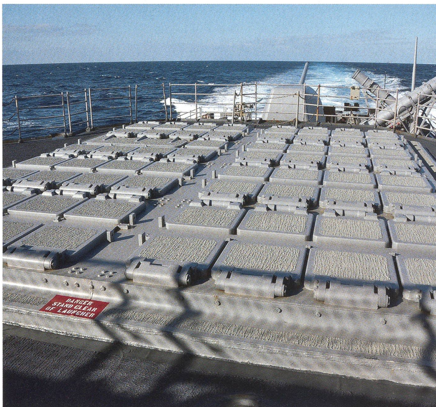
Zur Hauptbewaffnung der USS «Leyte Gulf» (CG 55) gehören zwei VLS (Vertical Launch Systems), welche über je 61 Startschächte für «Standard» SM-2 See-Luft-Lenk Waffen, «Tomahawk»-Marschflugkörper und «Asroc» Torpedos enthalten. Diese Aufnahme zeigt das VLS am Heck, ein 12,7 cm Geschütz sowie die acht «Harpoon» Schiff-Schiff-Werfer.