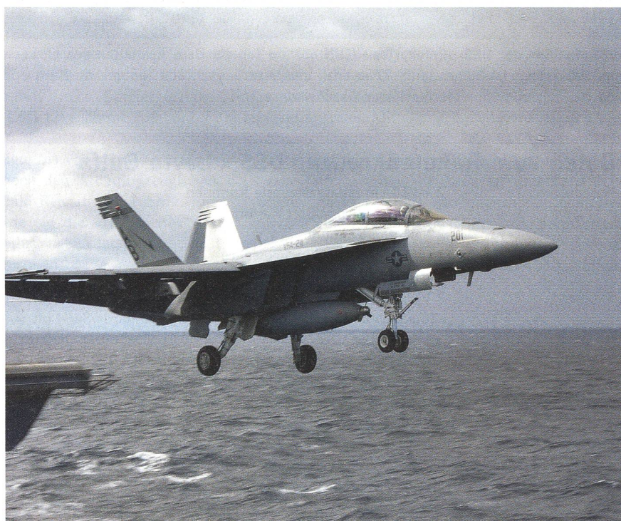
Eine F/A-18F «Super Hornet» der Fighter-Attack Squadron VFA-211 («Checkmates») wird vom Dampfkatapult Nummer 3 der USS «Enterprise» (CVN 65) gestartet. Nach der 90 Meter langen Strecke erreicht die Maschine eine Geschwindigkeit von 220 km/h.

dem Flugzeugträger beurteile, meinte Konteradmiral Kraft während eines ungezwungenen Gesprächs auf der Flaggbücke – ein Auge immer auf die Flugoperationen gerichtet – dass die heutigen Kampfflugzeuge und die Bewaffnung wesentlich effektiver seien als vor 30 Jahren. Ein Auftrag, der damals noch 6 – 8 Maschinen erfordert habe, könne heute mit vielleicht zwei Maschinen erfüllt werden. So sei insgesamt ein Fliegergeschwader von heute weit leistungsfähiger als die Geschwader aus den 60er-, 70er- und 80er-Jahren.