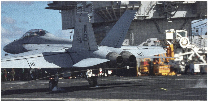
Eine F/A-18F der Fighter-Attack Squadron VFA-11 («Red Rippers») landet auf der USS «Enterprise» und erwischt das Fangseil Nummer 2 (von vier Fangseilen). Die mit etwa 240 km/h anfliegende Maschine wird dann auf einer Strecke von etwa 140 Metern zum Stillstand gebracht.

Angesprochen darauf, wie er die schrumpfende Zahl von Flugzeugen auf ei-