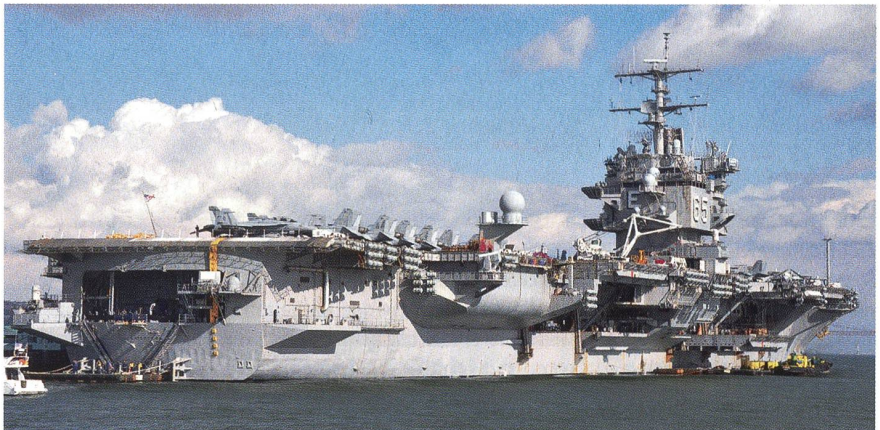
Ein Aufnahme der USS «Enterprise» (CVN 65) am Tag vor dem Auslaufen aus Lissabon. Der Träger ist 338 m lang, 77 m breit und verdrängt 95 000 Tonnen. An Bord sind 61 Flugzeuge des Marineflieger Geschwaders 1.