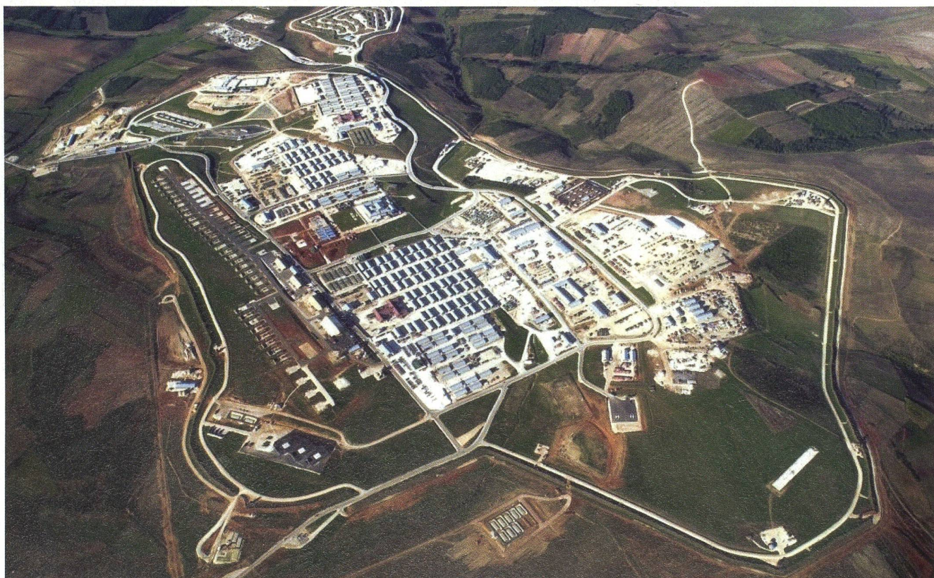
Camp Bondsteel: Von diesem Stützpunkt aus operiert seit dem 18. November 2010 das Schweizer Helikopter-Detachement.

Die Basis ist nach James Leroy Bondsteel, einem Vietnam-Helden, benannt. Bondsteel ist der grösste Stützpunkt, den die USA seit dem Indochina-Krieg bauten. red.