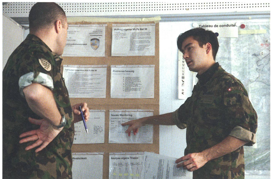
Der Teufel steckt im Detail – auch in der Kommunikation.

Die zunehmende Medialisierung der Gesellschaft verlangt ein gezieltes Issues Monitoring, dabei beobachtet und analysiert der PIO die aktuellen und möglichen Themen auf dem Radar. Als Kommunikationsberater des Kommandanten kommt dem PIO in Situationen mit grossem medialem Interesse eine tragende Rolle zu. Daher