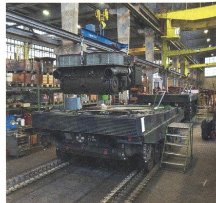
In einer RUAG-Werkhalle.