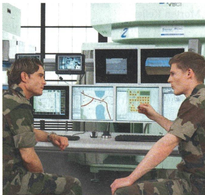
International im Geschäft.