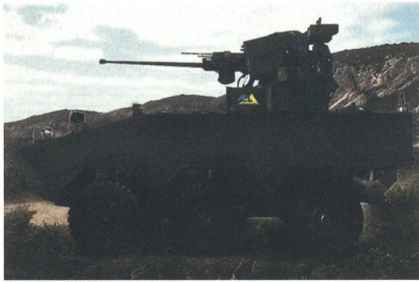
Kunstabild des VBTP-MR Guarani 6x6 mit Waffenstation UT30 BR.

Die brasilianischen Streitkräfte haben für ihre Radschützenpanzer des Typs IVECO VBTP-MR Guarani 6x6 fernbediente Waffenstationen des Typs UT30 BR bestellt. Die insgesamt 216 Systeme werden bei der lokalen Tochter von Elbit Systems, Aeroelectronica, gefertigt. In der Standardkonfi-