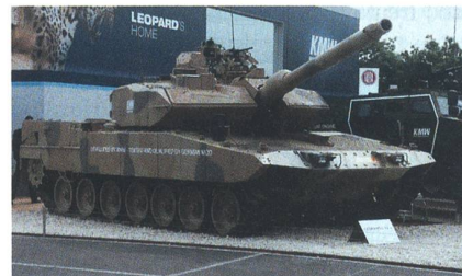
Kampfpanzer Leopard 2A7+.

Die neueste Version des Kampfpanzers Leopard, der Leopard 2A7+, wird aktuell bei intensiven Tests in Katar ausgiebig getestet. Hintergrund dieser Tests sind auch die Bestrebungen, den Leopard 2A7+ in Katar als Nachfolger für den veralteten AMX-30 ins Gespräch zu bringen. Der Leopard 2A7+ wurde in enger Zusammenarbeit mit der Bundeswehr entwickelt und ist für den Einsatz bei heissen Temperaturen. Als Bewaff-