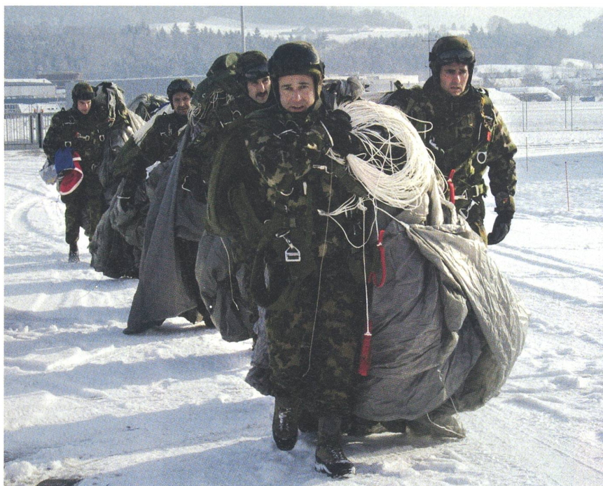
Die Fallschirmspringer rücken an – nach getaner Arbeit.

Er plädierte für Ehrlichkeit gegenüber der Öffentlichkeit und der Politik. Mit dem zur Verfügung stehenden Kostendach von 4,4 Mia. Fr. sei das neue Leistungsprofil schlicht nicht umzusetzen. Hier konnte der höchste AdA keinen Mut machen. Jede wei-