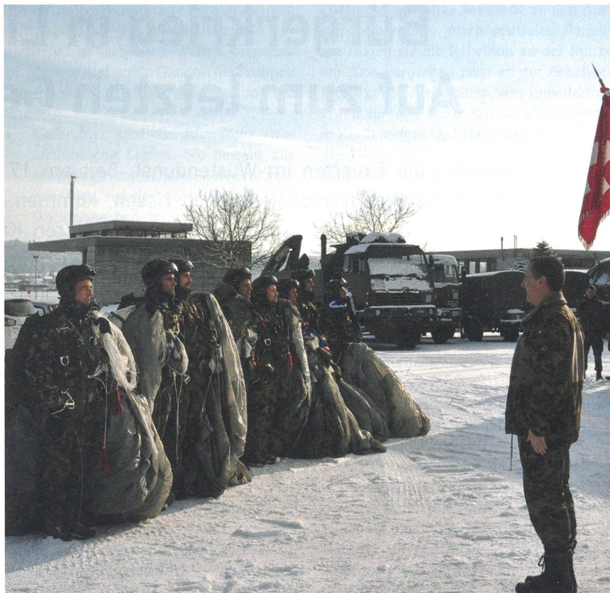
Die Fallschirmtruppe ist vor dem Brigadekommandanten angetreten.