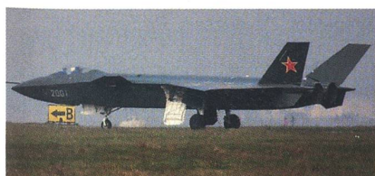
Chinesisches Kampfflugzeug der fünften Generation: J-20.

In China hat der erste Stealth-Kampffjet mit der Bezeichnung J-20 den Jungfernflug absolviert. China gehört somit nach den USA