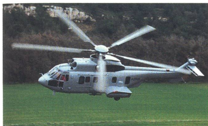
Eurocopter EC725 Cougar.

Die brasilianischen Streitkräfte haben die ersten drei von insgesamt 50 bestellten mittleren Transporthelikoptern des Typs EC725 erhalten. Der Auftrag mit einem Gesamtwert von 2,6 Milliarden Euro wurde im Jahr 2008 unterzeichnet. Jede Teilstreitkraft der brasilianischen Streitkräfte (Heer, Luftwaffe