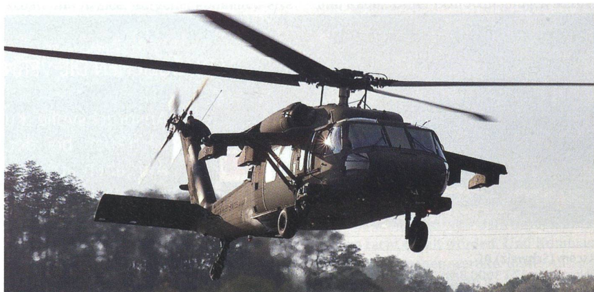
Sikorsky UH-60M im Landeanflug. Mexiko erhielt drei Maschinen.