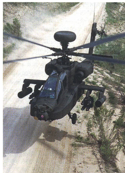
Helikopter AH-64D Apache Longbow.

Dieser erneute Auftrag zur Kampfwertsteigerung nach einem ersten Auftrag für 96 Maschinen im Jahr 2007 kommt daher, dass das Projekt und somit die Beschaffung von Helikoptern des Typs RAH-66 Comanche eingestellt wurde. Die AH-64-Familie wird aus diesem Grund auch in den kommenden Jahrzehnten der Standard-Kampfhelikopter