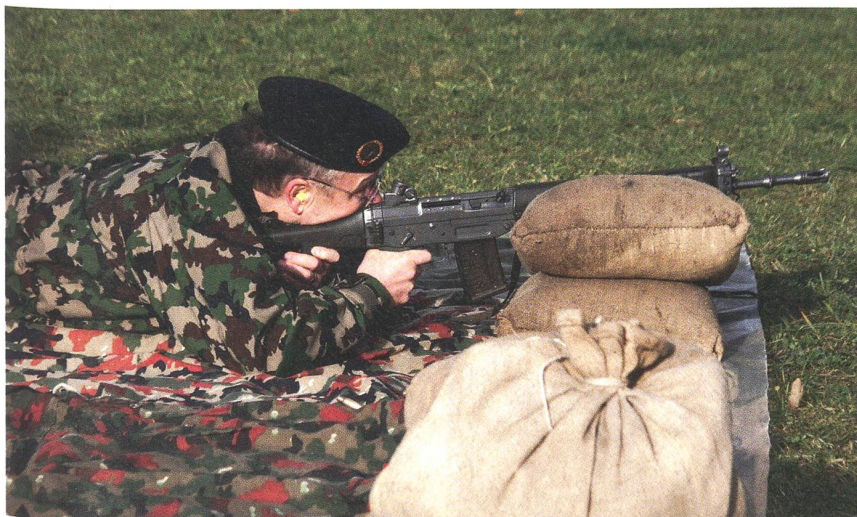
Zielsicher: Brigadier Martin Vögeli, der Kommandant Infanteriebrigade 7.

Die durchschnittliche Laufzeit betrug 23 Minuten. Ehrengast Brigadier Martin Vögeli liess es sich nicht nehmen, selber Hand anzulegen und den Schiesswettkampf sowie das UWK-Werfen zu bestreiten. Gewertet wurden die Resultate zwar ausser Konkurrenz, es darf aber gesagt werden, dass der Kommandant der Infanteriebrigade 7 eine Platzierung in den vorderen Rängen erzielt hätte. ah. ☐