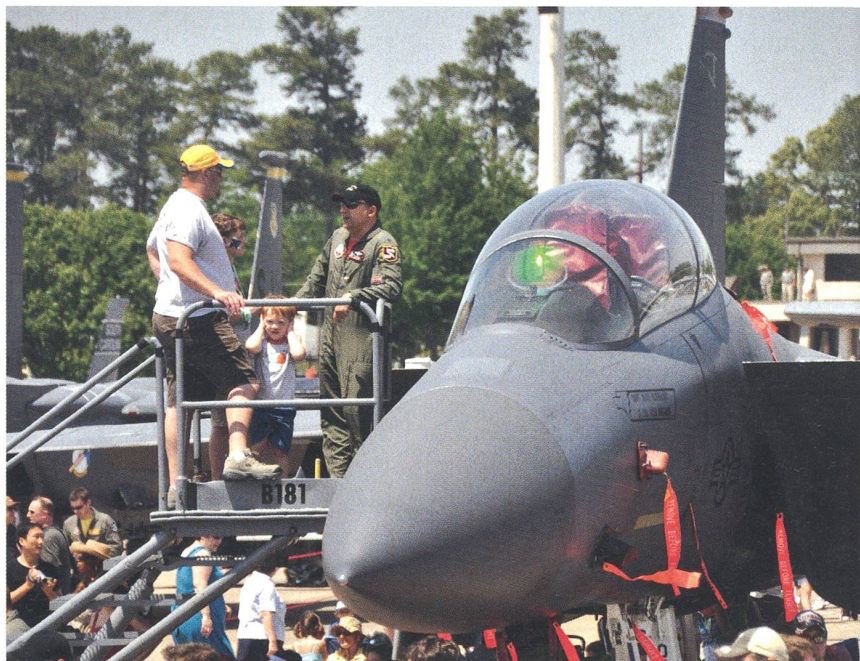
Über 150 000 Besucher haben den Open-House-Anlass auf der Seymour-Johnson AFB besucht. Dieser Stützpunkt ist heute Basis des 4. Jagdgeschwaders, welches mit 96 F-15E Strike Eagle ausgerüstet ist. Das Bild zeigt eine doppelsitzige F-15E Strike Eagle des 4th Tactical Fighter Wing, die von zahlreichen Besuchern belagert wird.

2010 sind es allein über 70 Auftritte an etwa 35 verschiedenen Orten in den USA.