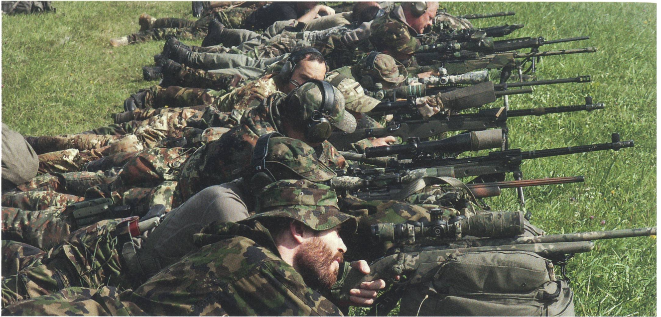
Die Aufnahme von der Schützenlinie vermittelt einen Eindruck von der Vielfalt der eingesetzten Gewehre.

genden elf Stunden wurden die Teilnehmer durch insgesamt 21 Stages geschickt, die das gesamte Spektrum des modernen Scharfschützenwesens beinhalteten.