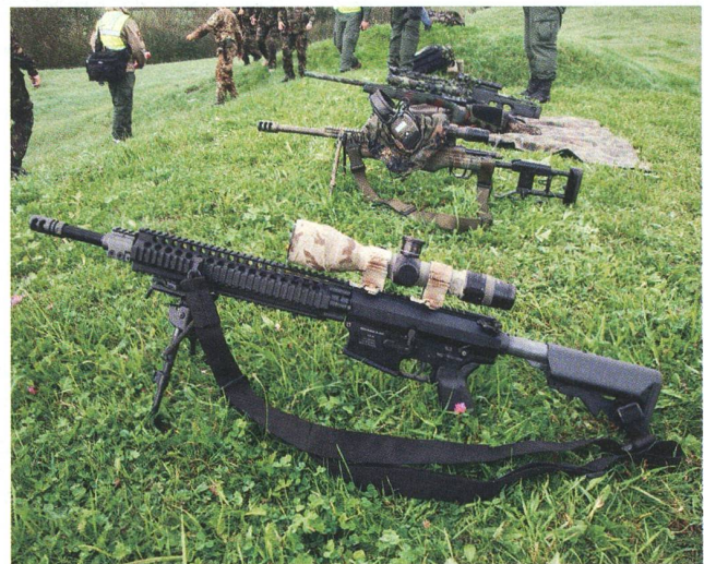
Scharfschützen setzen stets besonders treffsichere Waffen ein.