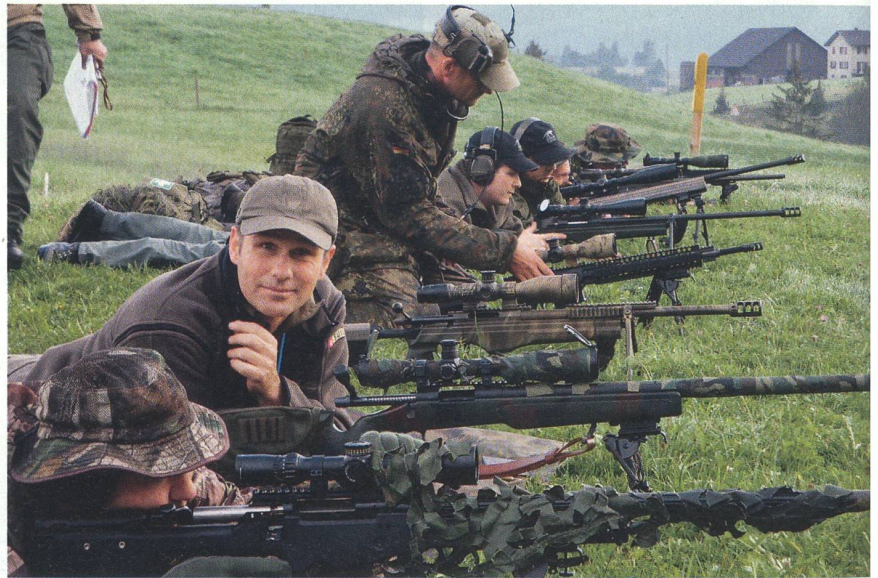
Aus der Schweiz und dem Ausland kamen die Scharfschützen zu «GALLINAGO 2010».

Entsprechend sollte das Handwerkszeug der Teilnehmer in Theorie und Praxis passen, denn ohne die entsprechende Korrektur der Parameter Waffe, ZF und Munition auf die Höhe des Platzes, Wind und