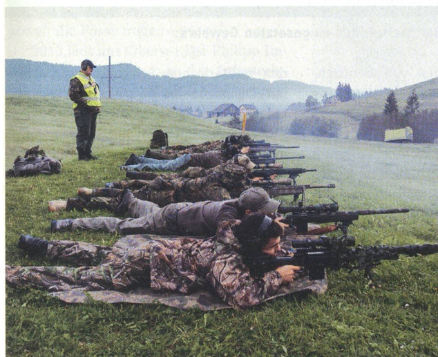
Die traditionelle Schützenlinie auf offenem Feld.