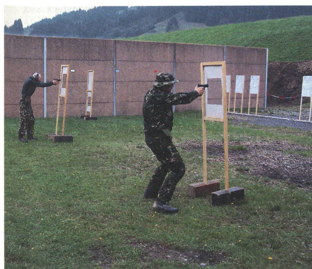
Schützen in der Kurzdistanz-Box auf dem Pistolenparcours.