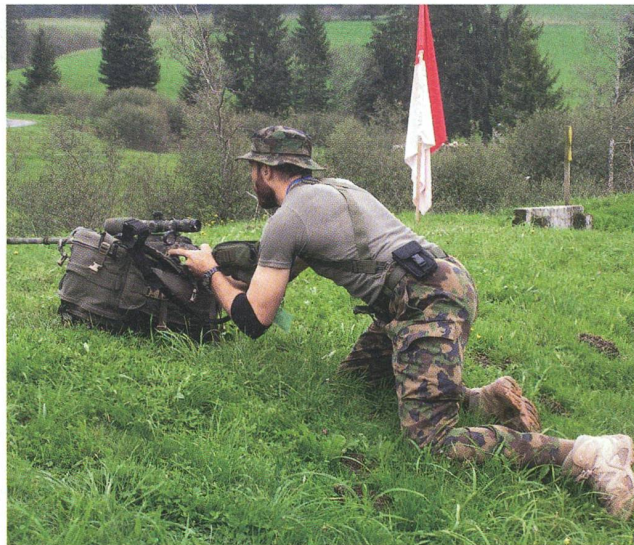
In strengem Einsatz: Scharfschütze bezieht Stellung.