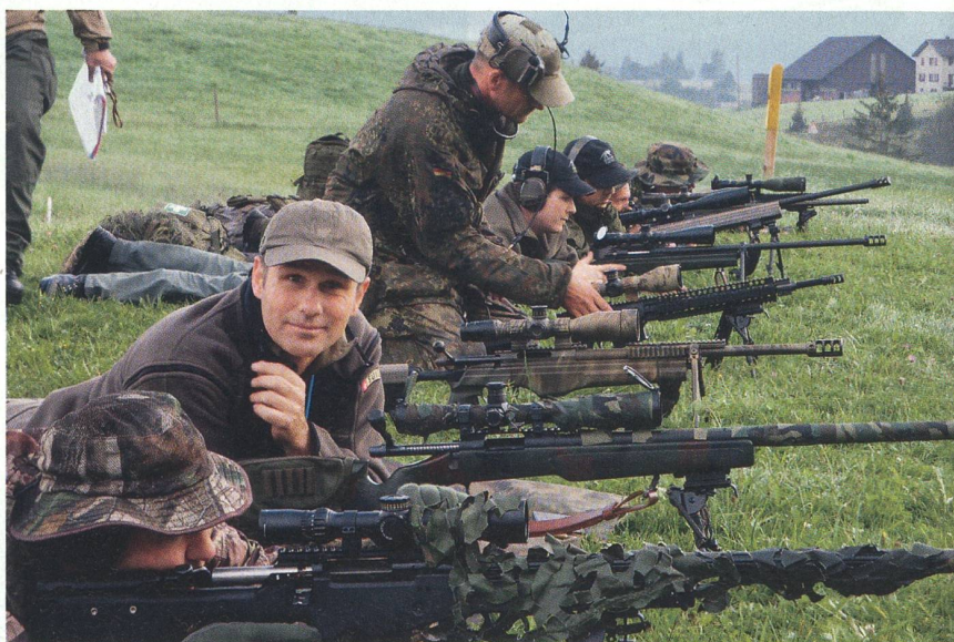
Aus der Schweiz und dem Ausland kamen die Scharfschützen zu «GALLINAGO 2010».

Entsprechend sollte das Handwerkszeug der Teilnehmer in Theorie und Praxis passen, denn ohne die entsprechende Korrektur der Parameter Waffe, ZF und Munition auf die Höhe des Platzes, Wind und