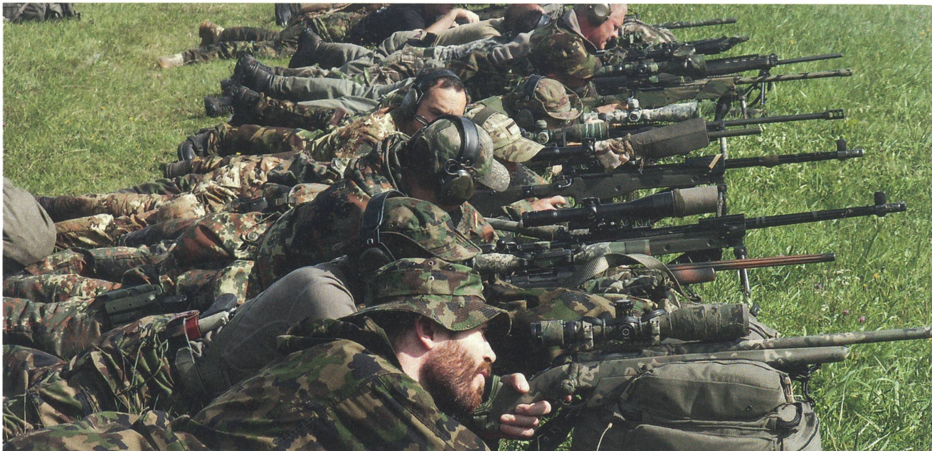
Die Aufnahme von der Schützenlinie vermittelt einen Eindruck von der Vielfalt der eingesetzten Gewehre.

genden elf Stunden wurden die Teilnehmer durch insgesamt 21 Stages geschickt, die das gesamte Spektrum des modernen Scharfschützenwesens beinhalteten.