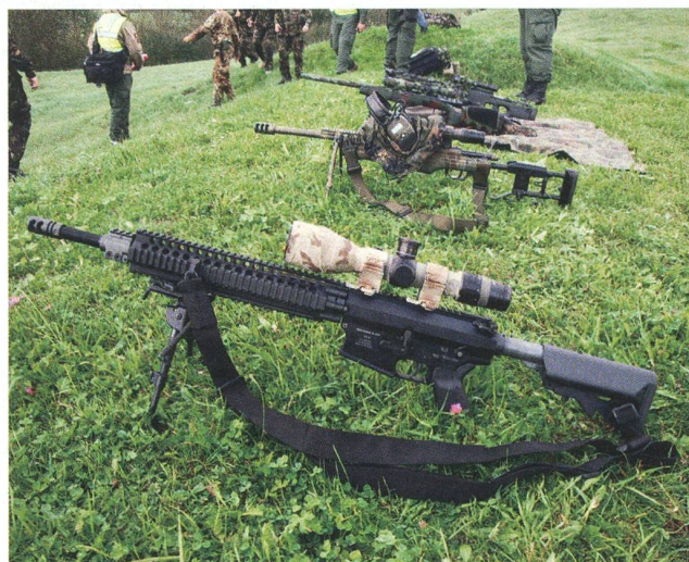
Scharfschützen setzen stets besonders treffsichere Waffen ein.