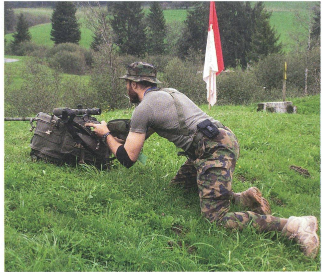
In strengem Einsatz: Scharfschütze bezieht Stellung.