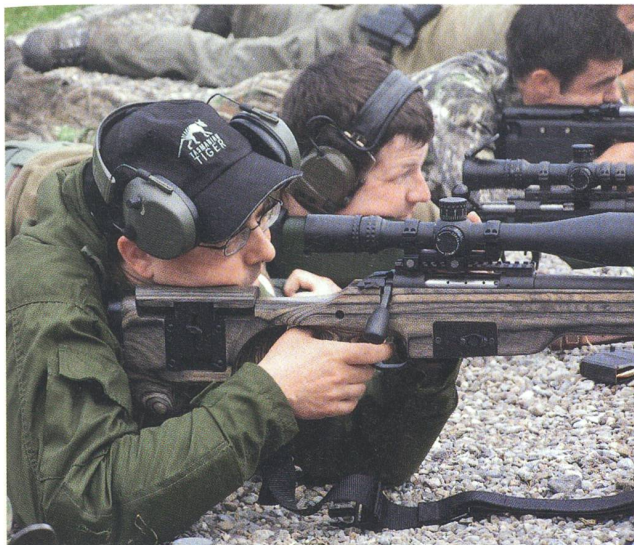
Der Wettkampf «GALLINAGO» erfordert höchste Konzentration.