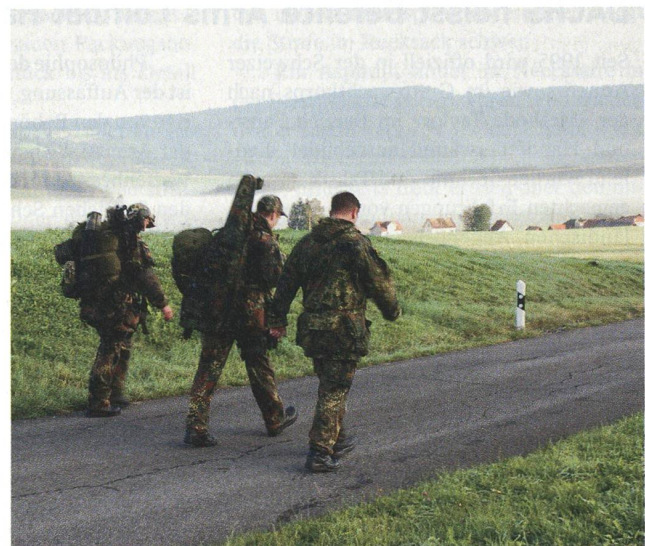
Auch der Marsch mit «Gepäck» gehört dazu.