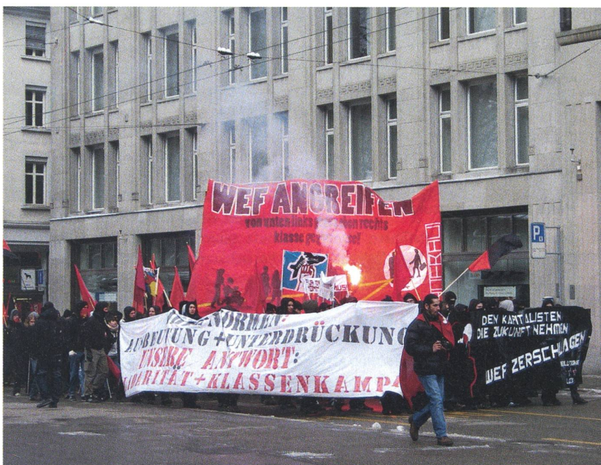
Unter dem Abfeuern von Signalraketen setzt sich die Anti-WEF-Kundgebung in St. Gallen in Bewegung.

Um 14 Uhr haben sich rund 200 teils verummte Demonstranten auf dem Bahnhofplatz versammelt. Sie führten Transparente mit, auf welchen zum Beispiel «WEF angreifen» oder «40 Jahre WEF-Mörder-treffen» zu lesen war. Kurze Zeit später setzte sich der Demonstrationszug Richtung St. Galler Fussgängerzone in Bewe-