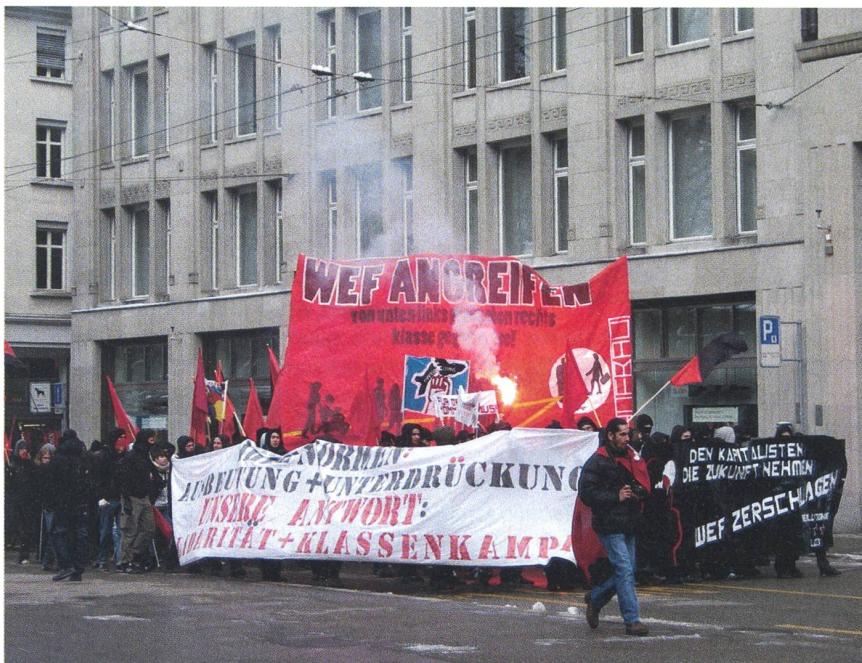
Unter dem Abfeuern von Signalraketen setzt sich die Anti-WEF-Kundgebung in St. Gallen in Bewegung.

Um 14 Uhr haben sich rund 200 teils verummte Demonstranten auf dem Bahnhofplatz versammelt. Sie führten Transparente mit, auf welchen zum Beispiel «WEF angreifen» oder «40 Jahre WEF-Mörder-treffen» zu lesen war. Kurze Zeit später setzte sich der Demonstrationszug Richtung St. Galler Fussgängerzone in Bewe-