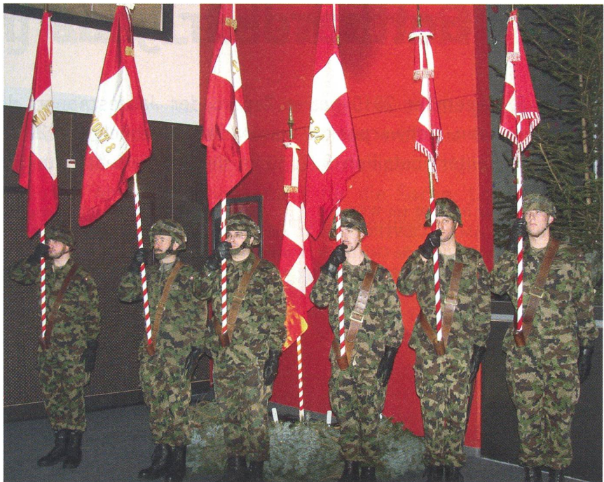
Die Standarten der Br sind mit den Fähnrichen aufmarschiert.

Der Umgang mit der Bevölkerung sei schwierig. Es sei nie klar, ob man Freund oder Feind vor sich habe. Es komme vor, dass man zusammen Tee trinke und freundschaftlich diskutiere und beim Abmarsch werde unverhofft aus dem Dorf auf die Truppe geschossen. Bei den verschleierte Frauen sei immer unklar, ob sie Waffen auf