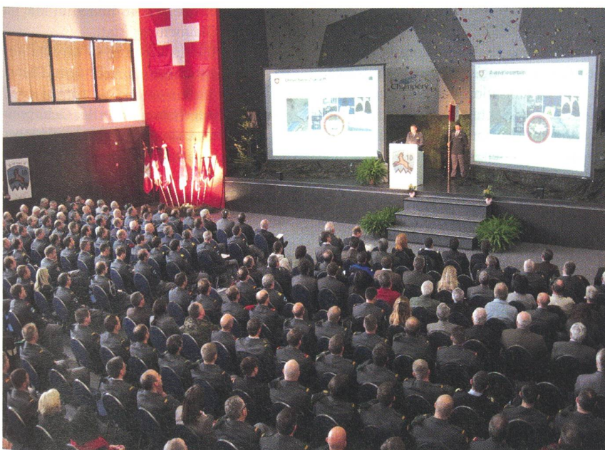
Zahlreiche Vertreter der Behörden, des Militärs, Ehemalige der Br, Aktive der Br sowie Ehefrauen und Partnerinnen wohnten dem Rapport im Palladium von Champéry bei.