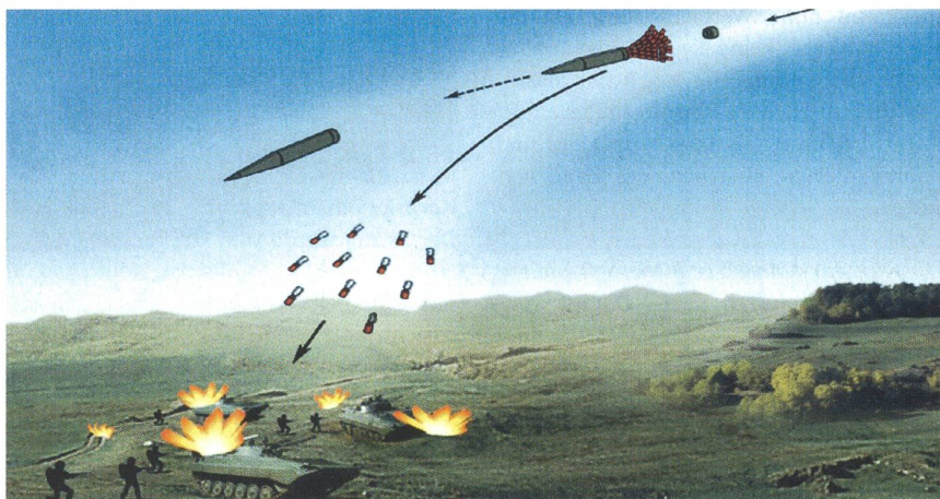
So trifft das 15,5-cm-Kanistergeschoss der Panzerhaubitze gegnerische Truppen.

Die Schweizer Artillerie, ein Waffensystem auf hohem Stand, verlöre ihre panzerbrechende Wirkung jenseits einer kurzen Distanz. Was wäre diese Artillerie noch wert? Nicht mehr viel!