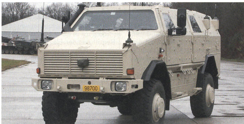
Das Allschutz-Transportfahrzeug DINGO bietet ein hohes Mass an Schutz.

Nur drei Wochen nach der Vertragsunterzeichnung hat KMW die ersten zehn hochgeschützten DINGO 2 der norwegischen Beschaffungsagentur NDLO übergeben. Parallel zur Fertigung wurden die Nutzer bei KMW im Umgang und Einsatz geschult. Die restlichen Fahrzeuge folgen bis Februar 2011. Die ersten DINGO 2 sind nun bereits in Afghanistan. Eingesetzt werden