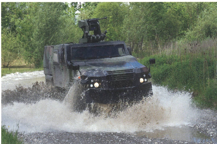
Der New EAGLE der Kreuzlinger Firma MOWAG bewährt sich in schwierigem Gelände.

Für Selbstverteidigungszwecke kann der New EAGLE mit verschiedenen Waffestationen ausgerüstet werden, die unter Panzerschutz fernbedient werden können.