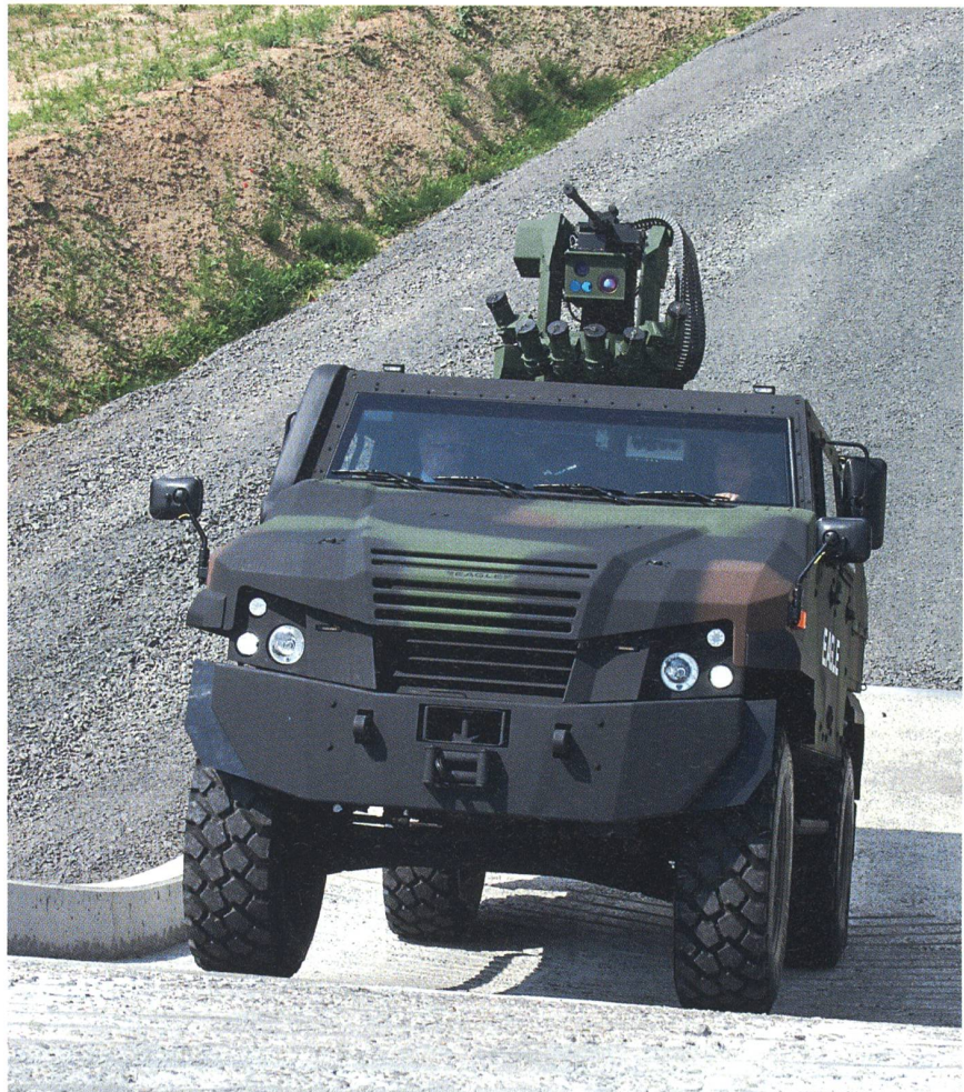
Zur Selbstverteidigung wird der New EAGLE mit einer Waffenstation ausgestattet.