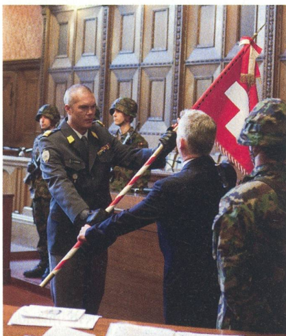
Basel: Das Ende des Panzerbataillons 25.