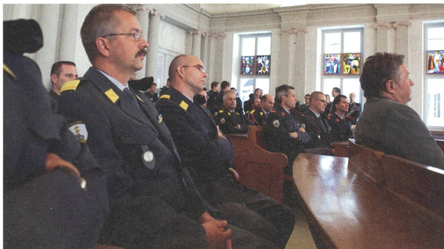
Panzergrenadierbataillon 27 in Glarus: Nachdenkliche Truppen- und Stabsoffiziere.