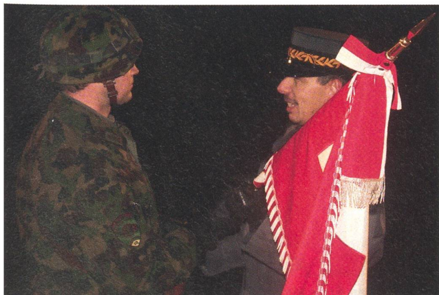
Br Keller übergibt die Standarte der Art Abt 10 dem Fähnrich.