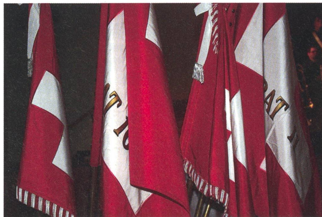
Die Feldzeichen der Inf Br 4 – zum letzten Mal vereint.