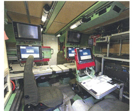
Der Innenraum eines FIS-Fahrzeuges.