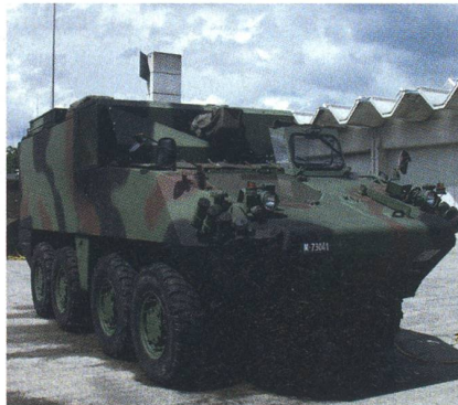
Der Radschützenpanzer FIS, ein Piranha.

In Tägerwil rüstet die MOWAG Piranha-1-Panzerjäger zu modernen Kommandopanzern um. Dabei baut sie überall auch Halterungen für die FIS-Bildschirme ein: die «FIS-Racks».