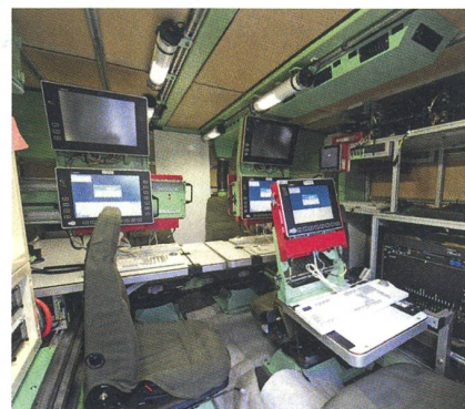
Der Innenraum eines FIS-Fahrzeuges.