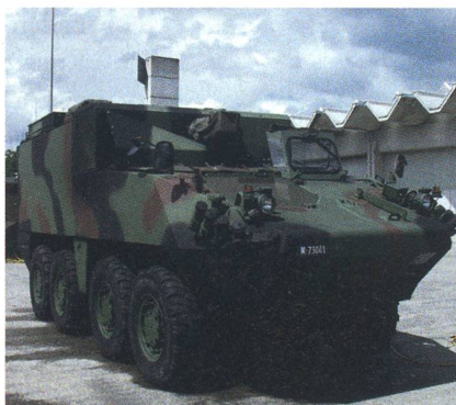
Der Radschützenpanzer FIS, ein Piranha.