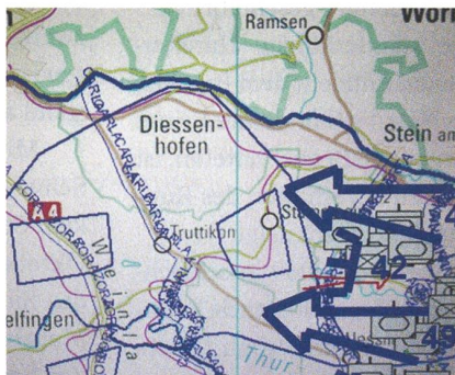
November 2009: Lagebild «OVERLORD».