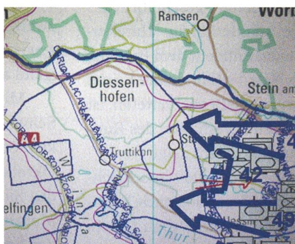
November 2009: Lagebild «OVERLORD».