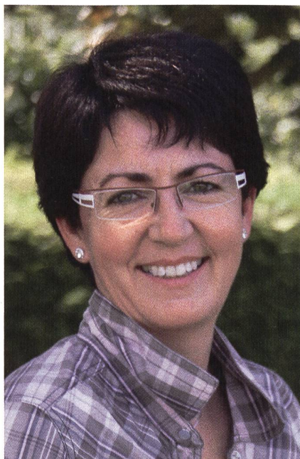
Die Autorin: Gabriele Wittlin-Landolt.

So sagen viele Rekruten, dass sie, wegen der Sprachschwierigkeiten, ihre Qualitäten nicht zeigen könnten. Wenn die Rekruten ihre Qualität nicht zeigen können, kann der Unteroffizier diese auch nicht sehen, was letztendlich das Bild der betroffenen Person nicht besonders positiv färbt. Insofern wird das Sprachvermögen ungewollt (?) zum Selektionskriterium. Ganze 84% der germanophonen, 67% der frankophonen und immerhin 57% der italophonen