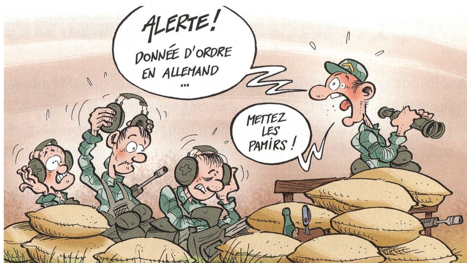
«Alarm. Befehlsgebung in deutscher Sprache. Setzt den Pamir auf!».

Die Hauptunterschiede zwischen der Privatwirtschaft und einer Institution sind zudem, dass die Privatwirtschaft keine Ar-