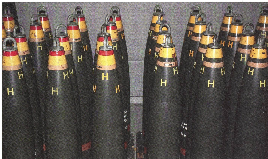
Beste Munition im Wert von mehreren 100 Millionen Franken verschrotten? Nein!

Die Sicherheitspolitische Kommission des Nationalrates stellt sich mit seiner Mehrheit gegen den Ständerat, der das Abkommen in der Herbstsession mit 27 zu 0 Stimmen ratifiziert hatte – wie schon einmal gemeldet, bei 19 Abwesenden, was in der Standeskammer selten vorkommt.