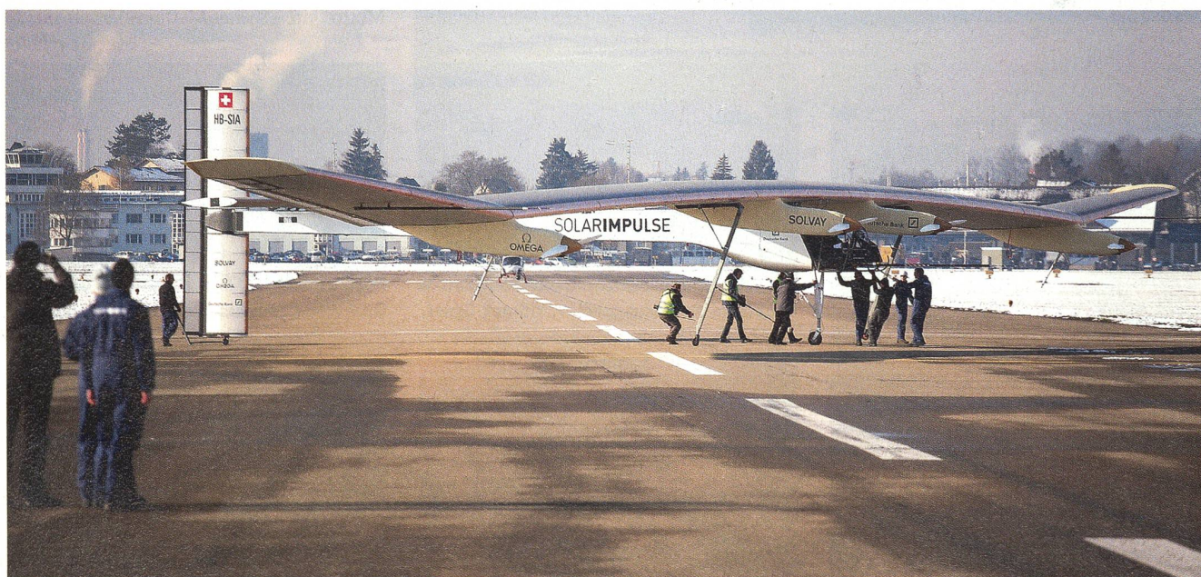
Solarimpulse auf dem Flugplatz von Dübendorf: Modernes Gerät mit imposanter Spannweite als Beispiel für moderne Nutzung.