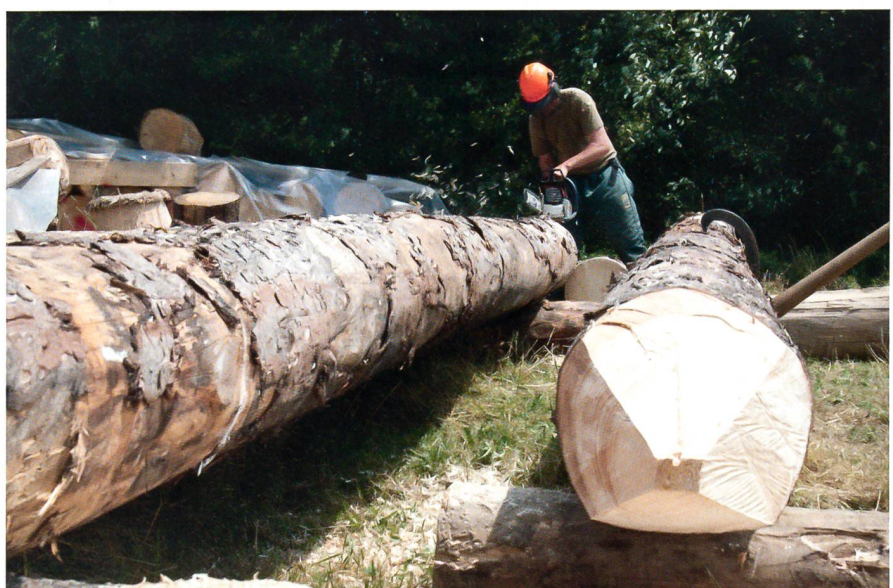
Die mit dem Helikopter eingeflogenen Pfähle werden zurechtgeschnitten.

Die einzelnen Stahlträger sind rund 2,5 Tonnen schwer und stellen somit hohe Ansprüche an die Lufttransport-Truppen.