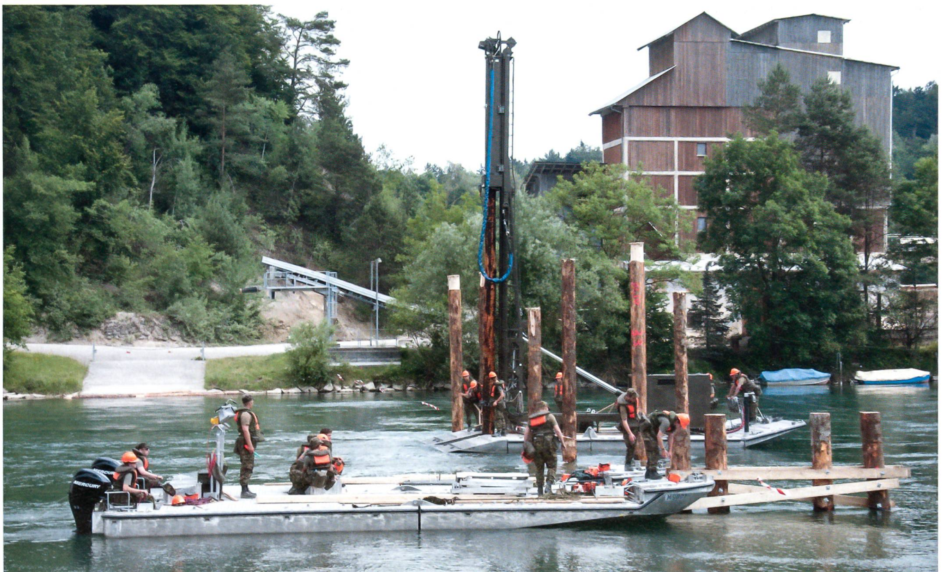
Um die Pfähle für die Pfeiler zu setzen, verwenden die Genisten eine Ramme.

Die Genie UOS/RS 73, die sich in der Verbandsausbildung befindet, wurde dem kantonalen Krisenstab zugewiesen. Weiter wird angenommen, viele Strassen seien wegen Überschwemmungen nicht passierbar, weshalb die Brückenelemente – insgesamt um die 200 Tonnen Material – durch zwei Super Pumas des Lufttransport-Geschwader 3 zur Einbaustelle transportiert werden müssen. «Dieses Szenario ist sehr realitätsnah. Somit können wir hier einen denkba-