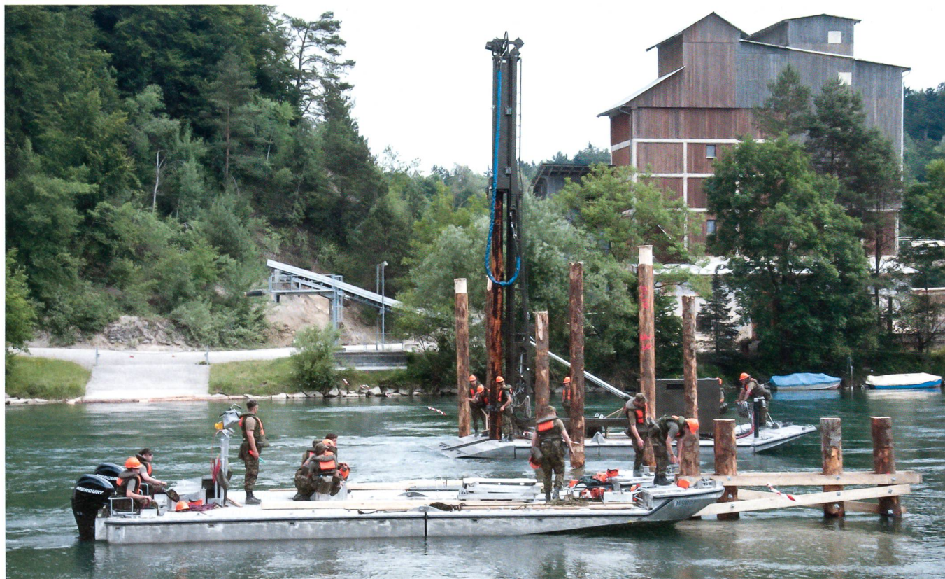
Um die Pfähle für die Pfeiler zu setzen, verwenden die Genisten eine Ramme.

Die Genie UOS/RS 73, die sich in der Verbandsausbildung befindet, wurde dem kantonalen Krisenstab zugewiesen. Weiter wird angenommen, viele Strassen seien wegen Überschwemmungen nicht passierbar, weshalb die Brückenelemente – insgesamt um die 200 Tonnen Material – durch zwei Super Pumas des Lufttransport-Geschwader 3 zur Einbaustelle transportiert werden müssen. «Dieses Szenario ist sehr realitätsnah. Somit können wir hier einen denkba-