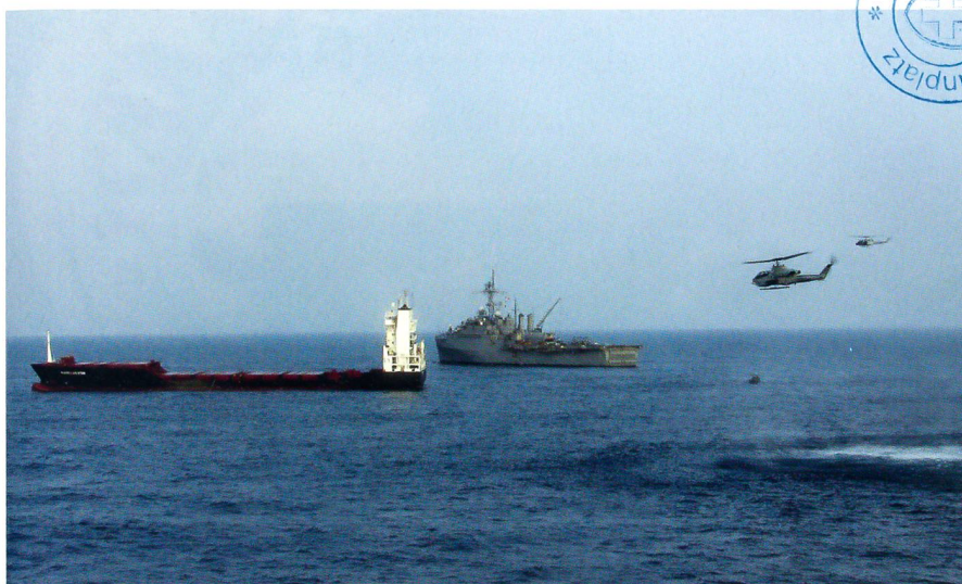
Am Horn von Afrika befreien Marines ein gekapertes Schiff (Seiten 40 bis 43).