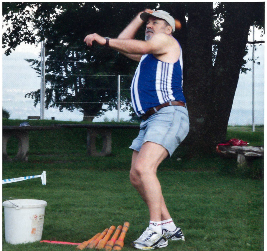
Konzentration und Präzision ist beim Zielwurf gefordert.