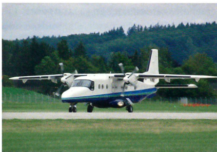
Testflug der Do 228NG.

wie ca. 300 weitere Verbesserungen an verschiedenen Flugzeugsystemen. Diese Modifikationen tragen massgeblich dazu bei,