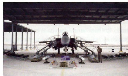
Saudi Arabische F-15S mit Waffenarsenal.

Das wichtigste Teilgeschäft ist die Ablösung der Tornado-Kampfflugzeuge durch 84 Jets des Typs F-15 Strike Eagle; möglicherweise werden die aktuell eingesetzten Flugzeuge des Typs F-15 A-d ebenfalls durch F-15 Strike Eagle abgelöst werden.