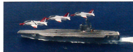
T-45 Goshawk überfliegen den Flugzeugträger USS George H. W. Bush.

Ein Jettrainer des Typs T-45 Goshawk der US Navy hat kürzlich die einmillionste Flugstunde dieses Typs bei den Marinefliegern der USA absolviert. Der zweiseitige