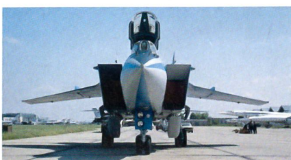
Kampfwertgesteigerte MiG-31 BM.

Die russische Luftwaffe hat die Kampfwertsteigerung der Langstreckenabfangjäger MiG-31 auf den BM-Stand abgeschlossen. Die MiG-31 BM verfügt über eine verbesserte Avionik mit digitalen Datalinks, einen neuen Mehrzweckradar, einem modernen Glas-Cockpit mit Farbdisplays, einen leistungsfähigen Rechner sowie die Möglich-