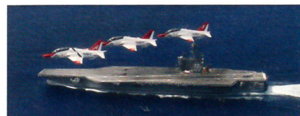
T-45 Goshawk überfliegen den Flugzeugträger USS George H. W. Bush.

Ein Jettrainer des Typs T-45 Goshawk der US Navy hat kürzlich die einmillionste Flugstunde dieses Typs bei den Marinefliegern der USA absolviert. Der zweisitzige