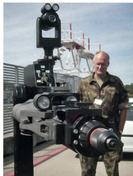
Auch das gehört dazu: Ein Roboter auf Rädern, der gefährliche Objekte sprengt.