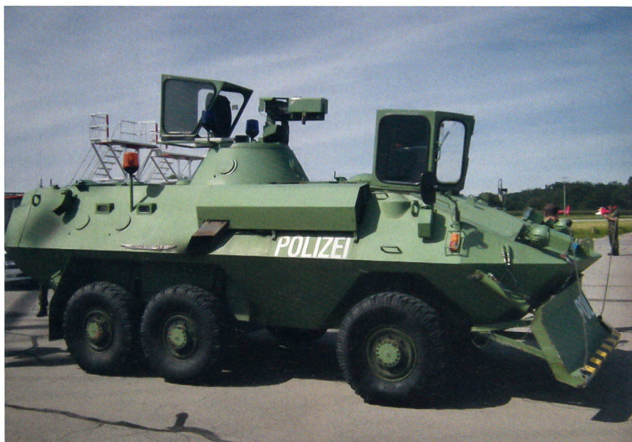
Unverkennbar ein MOWAG-Piranha-1: Ein Radschützenpanzer der Flughafen-Polizei.

Rudolf Farner vom Sicherheitsdienst des Flughafens führte mit eindrücklichen Zahlen vor Augen, wie bedeutend «Kloten» für die Region Zürich und die ganze Schweiz ist. 2009 bewältigte der Flughafen 22 Millionen Passagiere. In den Spitzenmonaten Juli, August und Oktober waren es je