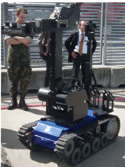
Die Flughafen-Feuerwehr von Zürich-Kloten verfügt über das modernste Gerät.