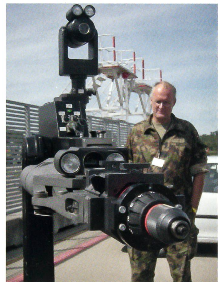
Auch das gehört dazu: Ein Roboter auf Rädern, der gefährliche Objekte sprengt.