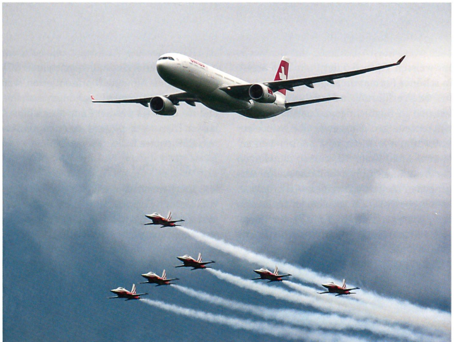
Die Formation Airbus A-330-300 der Swiss zusammen mit der Patrouille Suisse bildete einen der Höhepunkte des Meetings.