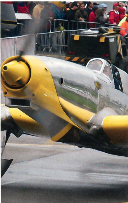
Eine Schweizer Konstruktion, das Zielschleppflugzeug C-3605.