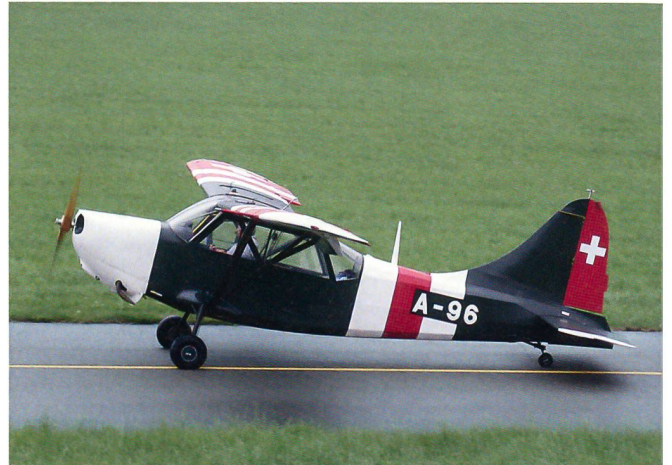
Verbindungsflugzeug Stinsin L-5A in den Farben der Truppe.