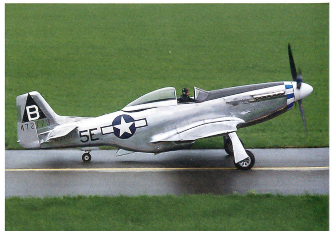
P-51 Mustang – 130 Stück standen im Einsatz.