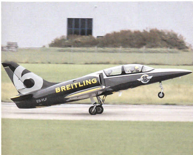
Albatross L-39 des Breitling-Jet Teams bei der Landung.