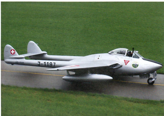
Der erste Düsenjet der Luftwaffe, Vampire DH-100.