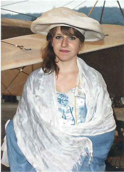
Historische Kleidung wie vor 100 Jahren.