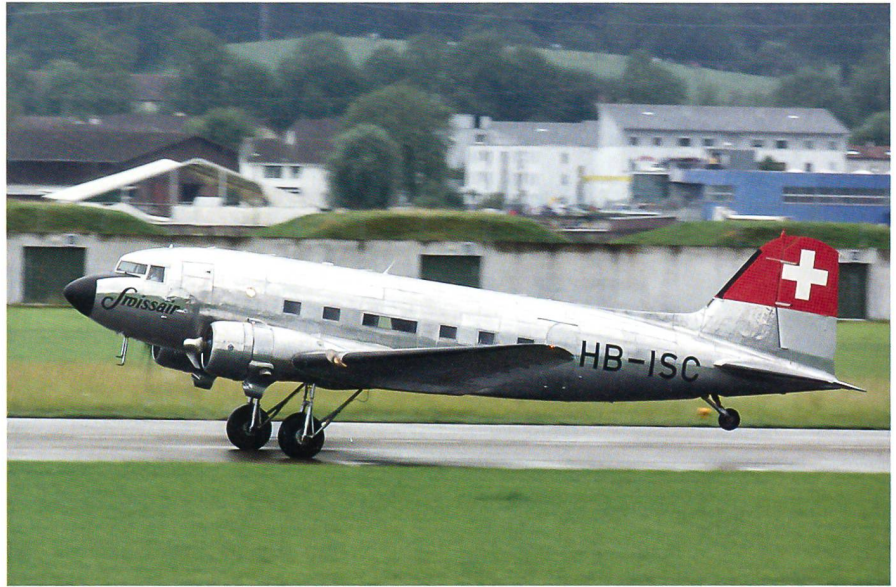
Die DC-3 beim Start – ein ehrwürdiges Flugzeug! Insgesamt gab es 15 592 DC-3.