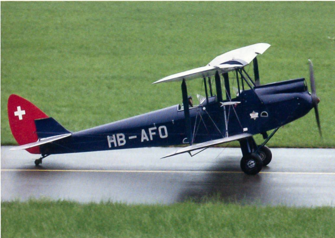
De Havilland DH-60 G Gipsy Moth mit Jahrgang 1931.