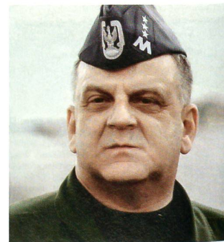
Generalleutnant Andrzej Blasik, der Kommandant der polnischen Luftwaffe, auch er Pilot, nahm im Cockpit Platz.