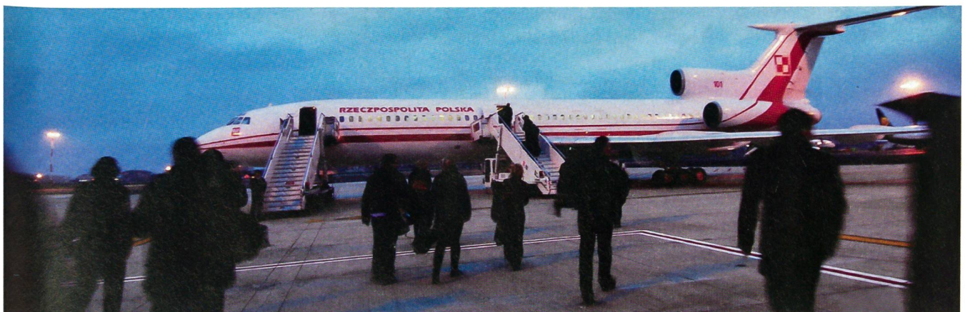
Die Präsidentenmaschine Tupolew-154. Vorne stiegen der Präsident und sein Gefolge ein, hinten die anderen Passagiere.