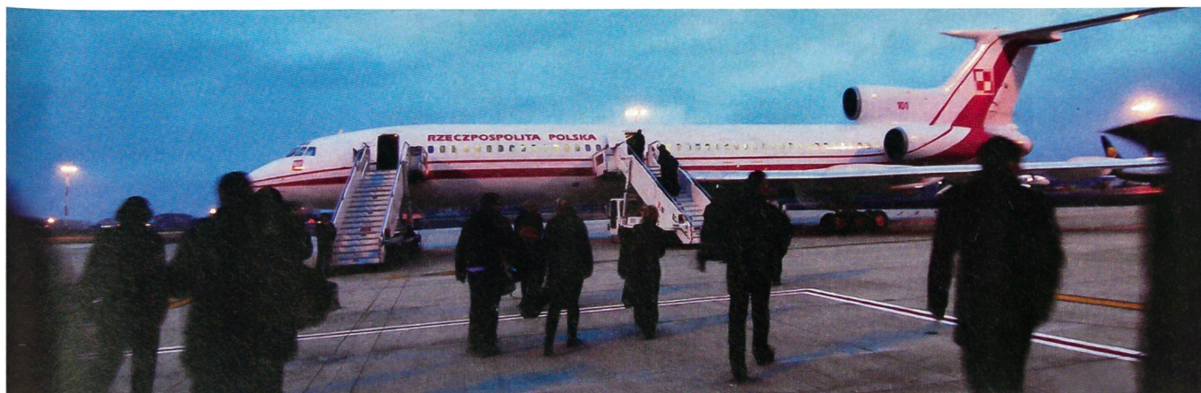
Die Präsidentenmaschine Tupolew-154. Vorne stiegen der Präsident und sein Gefolge ein, hinten die anderen Passagiere.