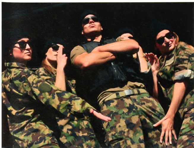
Foire du Valais: Präsentation der «VBS-Mode».