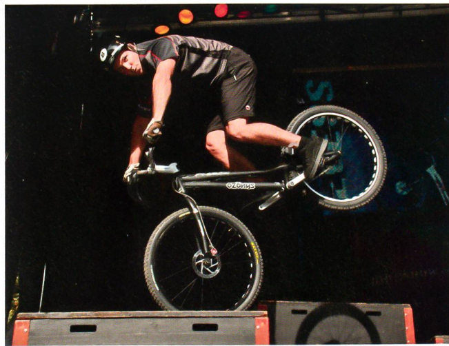
Hohe Kunst in Martigny: die gelungene Bike-Show.