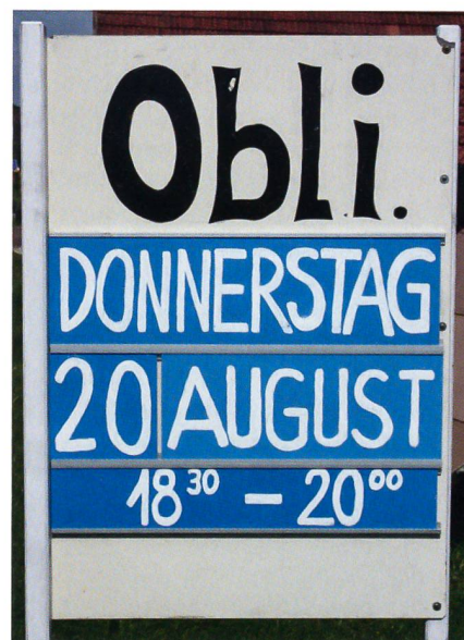
Schützentraktion: Das Obligatorische.

armee. Warum bringt die Initiative keine Sicherheit? Weil sie den kriminellen Waffenmissbrauch nicht verhindert.»