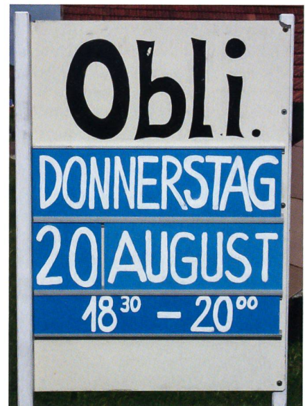
Schützentradiation: Das Obligatorische.

armee. Warum bringt die Initiative keine Sicherheit? Weil sie den kriminellen Waffenmissbrauch nicht verhindert.»