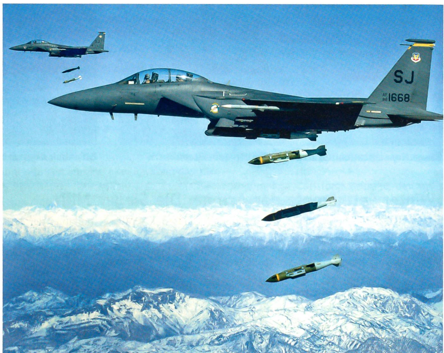
Im richtigen Moment aufgenommen: Der Abwurf von JDAM-Bomben.

Der Nachrüstsatz für die 2000-Pfund-Bombe trägt die Bezeichnung GBU-31; für