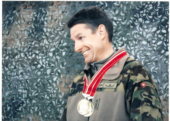
Glücklich über den Gewinn von zwei Medaillen.