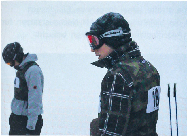
Ganze Konzentration auf das Rennen vor dem Start.