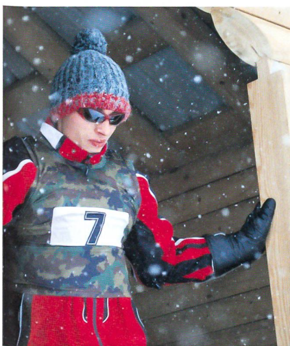
Wie bei Olympia: Volle Kraft am Start.