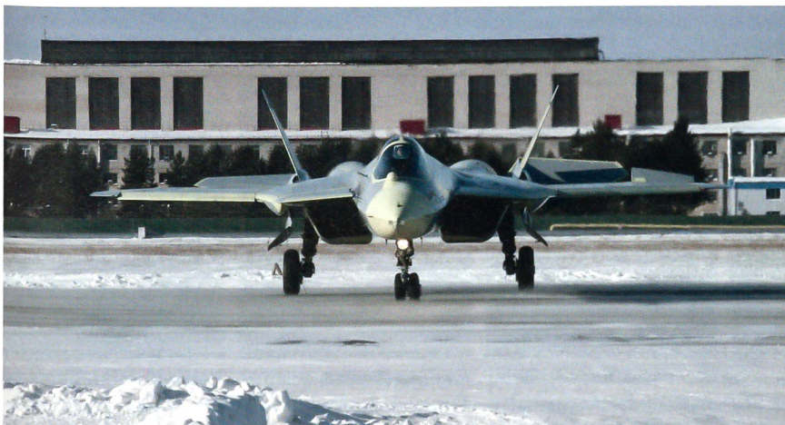
Der Mehrzweckjäger Suchoi T-50 nach seinem Jungfernflug vom 29. Januar 2010.