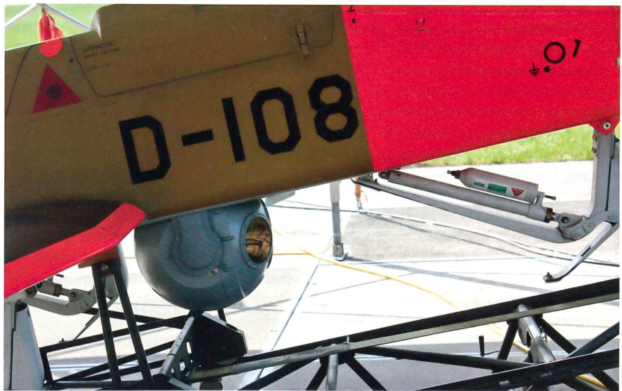
Die ADS-95-Drohne mit der kugelrunden Kamera auf der Rampe in Payerne.

Es gehe also darum, nicht nur fliegen zu können, sondern auch zum Beispiel die Fähigkeit command and control zu behalten: «Kernkompetenz und nicht nur Wisenserhalt ist das Thema.»