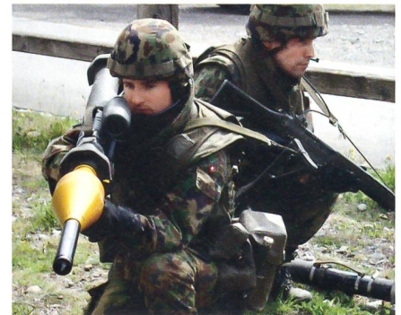
Ein Trupp der Grenadierkompanie 30/2 mit Panzerfäusten in Walenstadt.

Ziele der Neuordnung, die am 1. Mai 2010 beginnt und bis Ende 2011 abgeschlossen wird, sind die Optimierung von Leistungen, die Beseitigung von Doppelspurigkeiten sowie Kosteneinsparungen durch Zusammenlegung von Kommandos, Vereinheitlichung der Prozesse sowie Anpassung der Bereitschaft und Zentralisie-