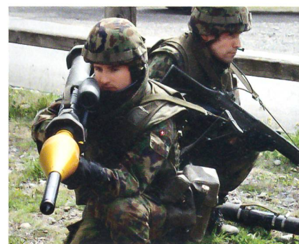
Ein Trupp der Grenadierkompanie 30/2 mit Panzerfäusten in Walenstadt.

Ziele der Neuordnung, die am 1. Mai 2010 beginnt und bis Ende 2011 abgeschlossen wird, sind die Optimierung von Leistungen, die Beseitigung von Doppelspurigkeiten sowie Kosteneinsparungen durch Zusammenlegung von Kommandos, Vereinheitlichung der Prozesse sowie Anpassung der Bereitschaft und Zentralisie-