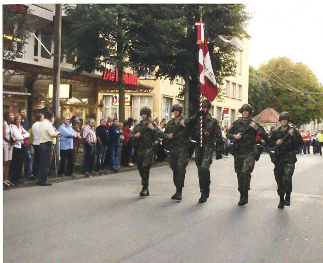
Die Fahne des Infanteriebataillons 13.