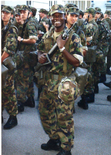
Das Gewehr vorgehängt.