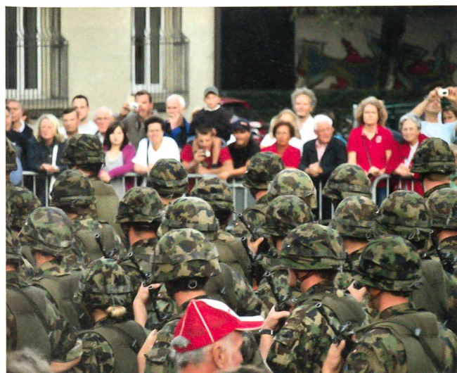
Armee und Bevölkerung rücken nahe zusammen.