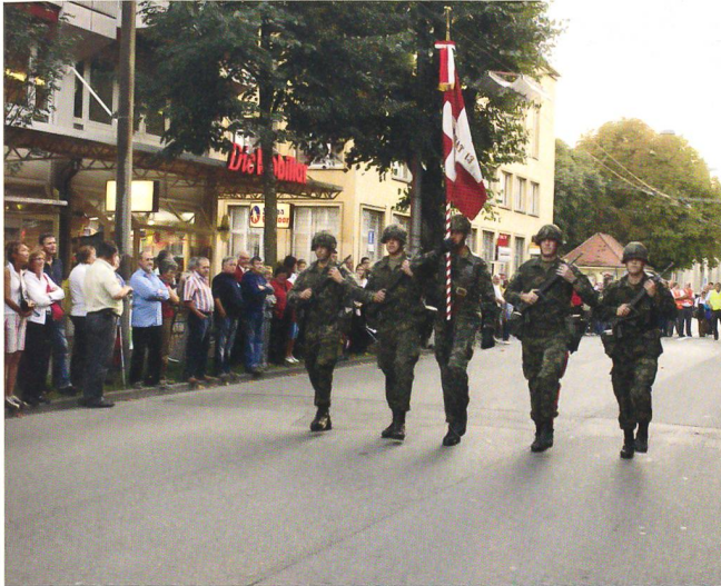
Die Fahne des Infanteriebataillons 13.