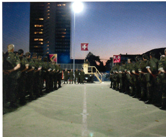
Der feierliche Schlusspunkt.