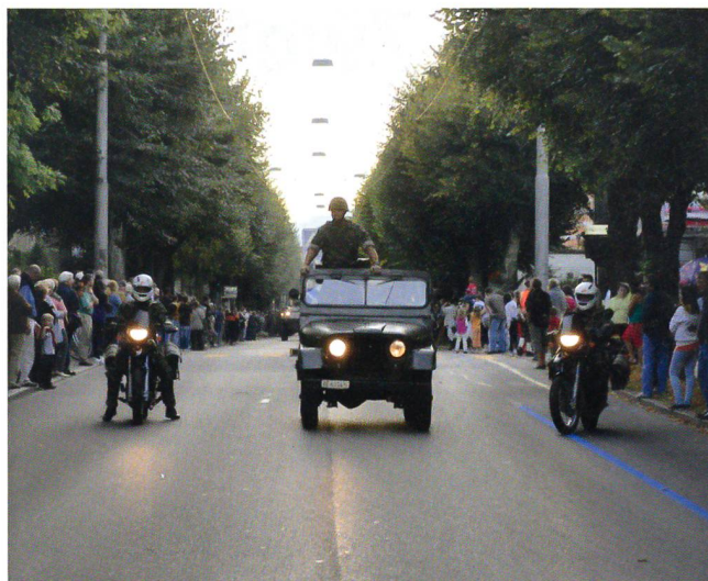
Der Bataillonskommandant fährt vor.