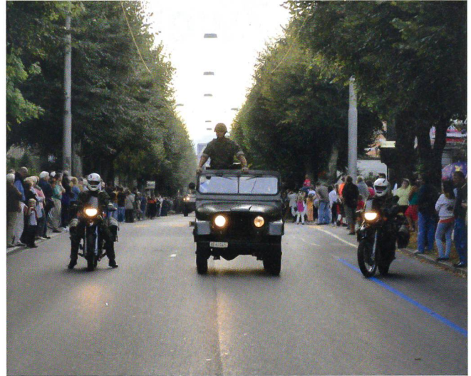
Der Bataillonskommandant fährt vor.