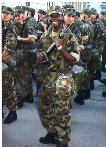
Das Gewehr vorgehängt.