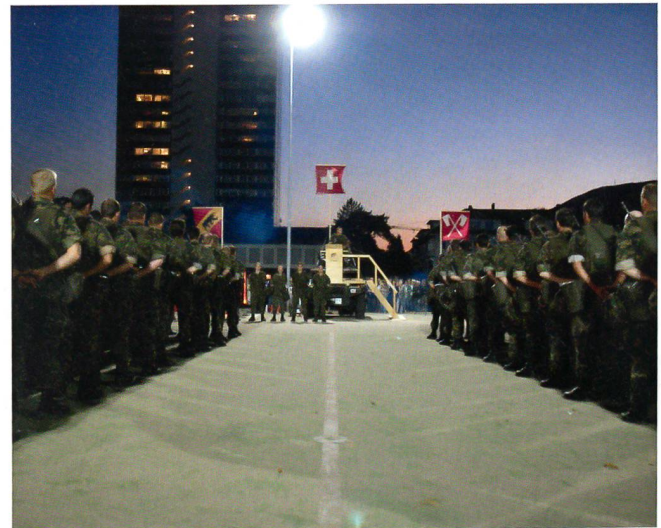
Der feierliche Schlusspunkt.