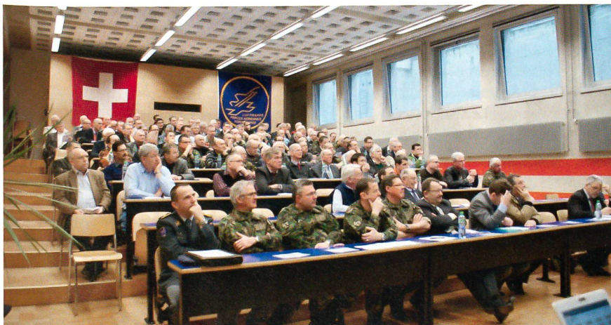
Gespannte Aufmerksamkeit an der Versammlung in Payerne.