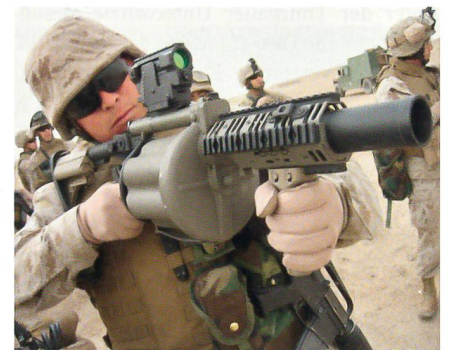
US Marine mit Granatwerfer M-32.

Der M-32-Granatwerfer der US Marines verschießt 40-mm-Granaten und verfügt über ein sechsschüssiges Magazin. Er verfügt über einen Einschubschaff, optische Zielhilfe sowie einen Vorderschaft mit Standardschienen zum Anbringen von modularem Zube-