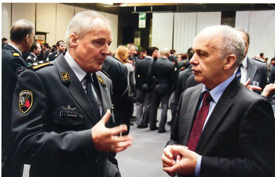
Divisionär Hans-Ulrich Solenthaler im Gespräch mit Bundesrat Ueli Maurer.

Im Hinblick auf die im September 2010 stattfindende Übung AEROPORTO 10 mit 5000 Armeeangehörigen im Einsatz wurden hochkarätige Referenten aus der Aviatik und der Sicherheit eingeladen. Thomas E. Kern, CEO des Flugplatzes, stellte klar, dass die Sicherheit in der Luftfahrt noch vor ökonomischen und politischen Fragestel-