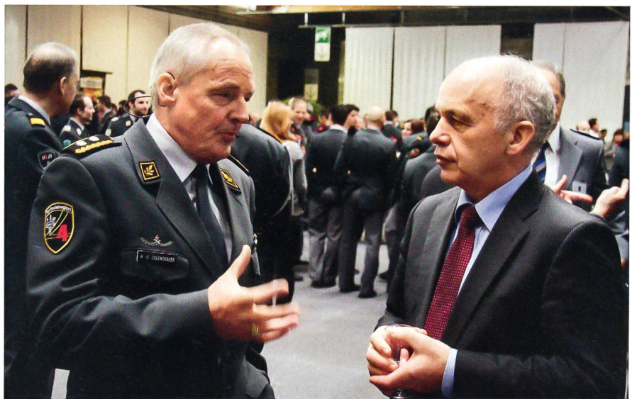
Divisionär Hans-Ulrich Solenthaler im Gespräch mit Bundesrat Ueli Maurer.

Im Hinblick auf die im September 2010 stattfindende Übung AEROPORTO 10 mit 5000 Armeemitgliedern im Einsatz wurden hochkarätige Referenten aus der Aviatik und der Sicherheit eingeladen. Thomas E. Kern, CEO des Flugplatzes, stellte klar, dass die Sicherheit in der Luftfahrt noch vor ökonomischen und politischen Fragestel-